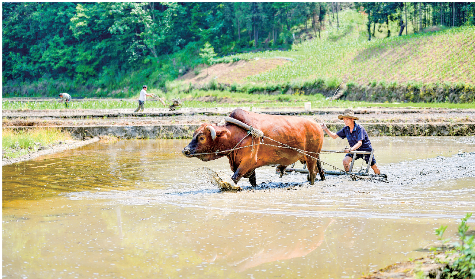
连日来,石泉县城关镇1000余亩水田呈现一片农忙景象,农户们抢抓农时,开展除草、施肥、耕田、平整等工作。