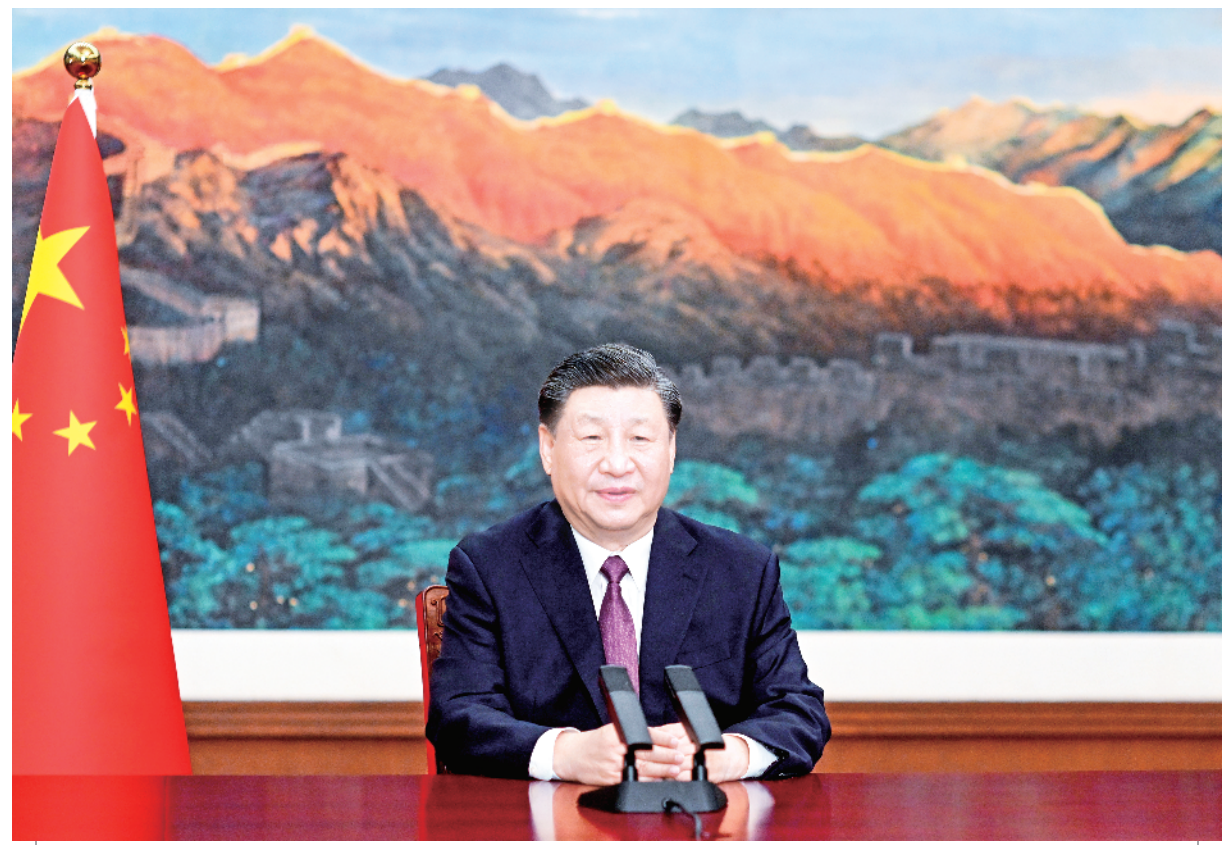
5月24日，国家主席习近平应邀以视频方式出席欧亚经济联盟第二届欧亚经济论坛全会开幕式并致辞。

新华社北京5月24日电 5月24日，国家主席习近平应邀以视频方式出席欧亚经济联盟第二届欧亚经济论坛全会开幕式并致辞。 习近平指出，当今世界正处于百年未有之大变局，世界多极化、经济全球化历史潮流势不可当。坚持真正的多边主义，推动区域协调发展，是国际社会广泛共识。亚欧大陆是世界上人口最多、国家最多、文明最具多样性的地区。面对动荡变革的世界，亚欧合作之路应该怎么走？这不仅关乎地区人民福祉，也深刻影响世界发展走向。