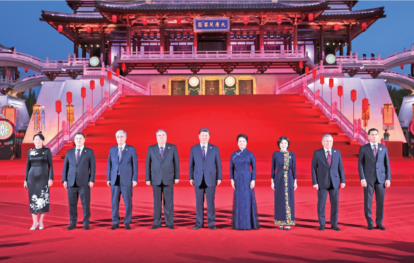
5月18日晚，国家主席习近平和夫人彭丽媛在陕西省西安市大唐芙蓉园为出席中国—中亚峰会的中亚国家元首夫妇举行欢迎仪式和欢迎宴会。宴会后，习近平夫妇同贵宾们共同观看中国同中亚国家人民文化艺术年暨中国—中亚青年艺术节开幕式演出。这是习近平发表欢迎致辞，代表中国政府和中国人民热烈欢迎中亚各国元首。