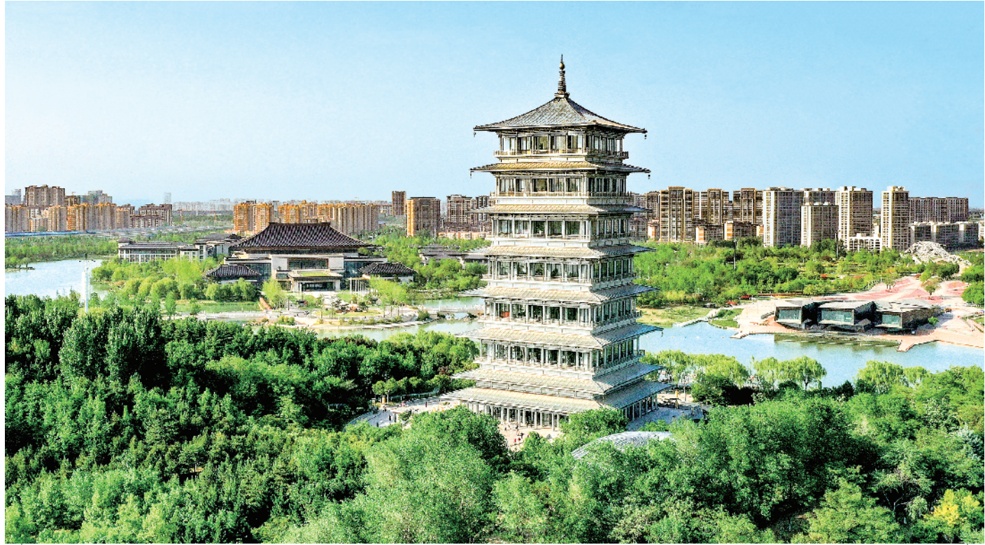
位于西安浐灞生态区的长安塔(2023年4月16日摄,无人机照片)。