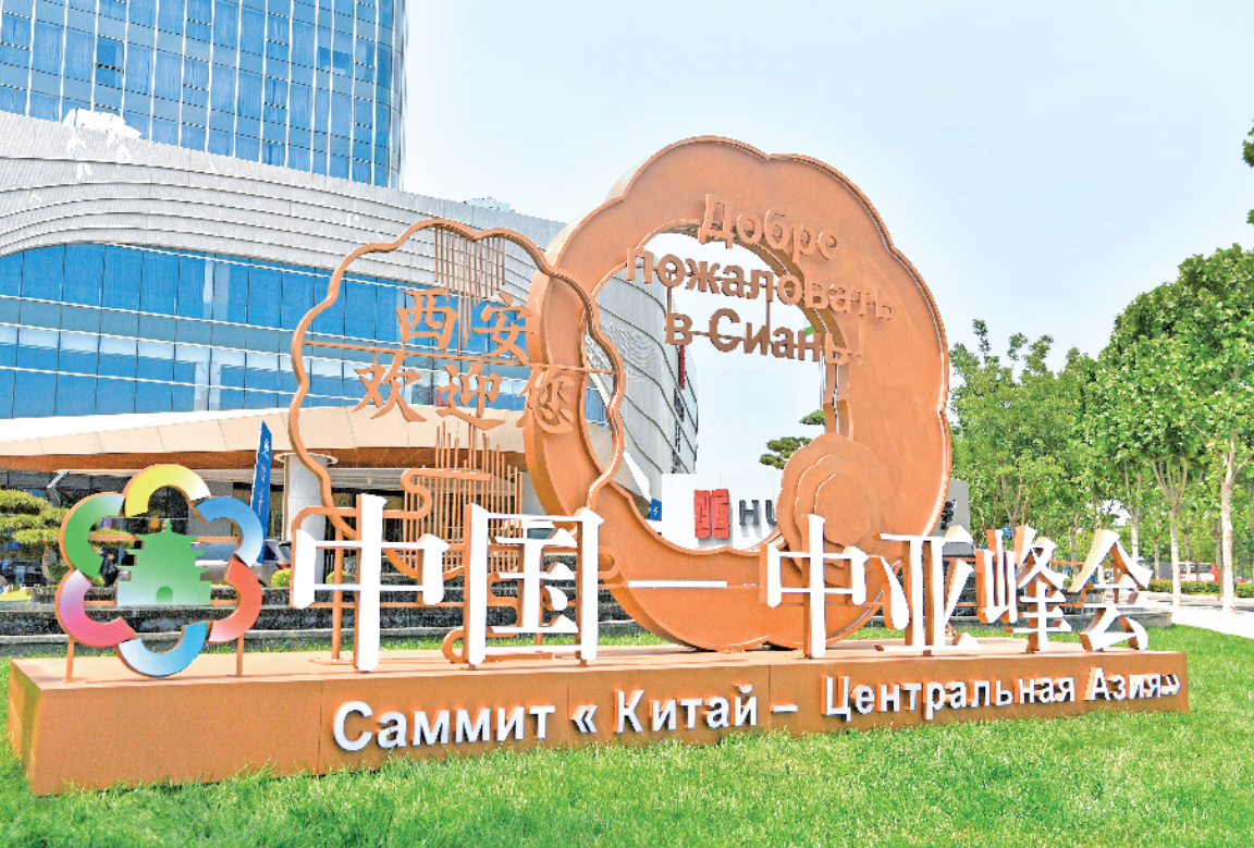
这是5月16日拍摄的中国—中亚峰会新闻中心外景。