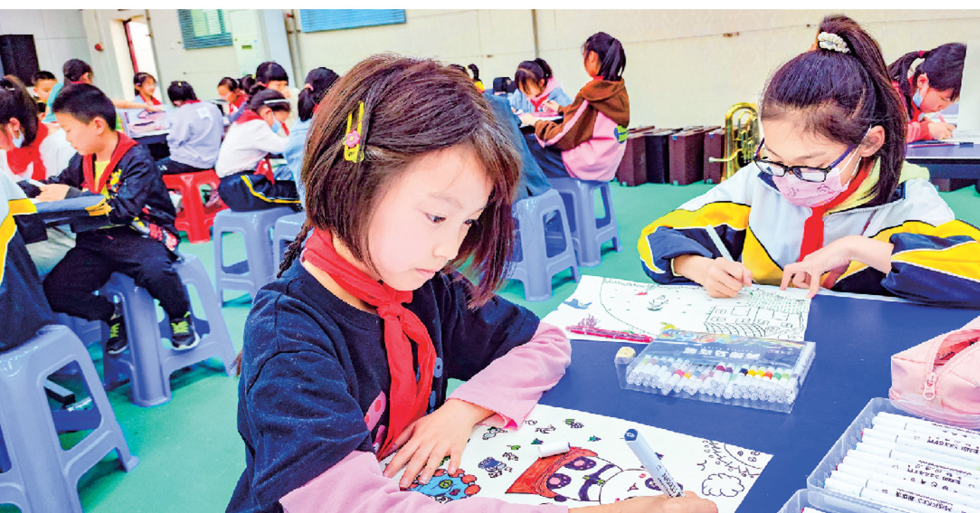
近日,旬阳城关小学举办绘画现场赛,比赛以“健康、快乐”为主题,勾画出对未来生活的美好憧憬。本次书画类比赛是该校“共绘二十大,谱写新篇章”科技体育艺术节的一部分,活动有近600名学生参加。