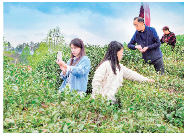
平利县蒋家坪景区再次迎来旅游小高峰。游客在茶园内踏青赏景、拍照游玩，尽享春日美好时光。