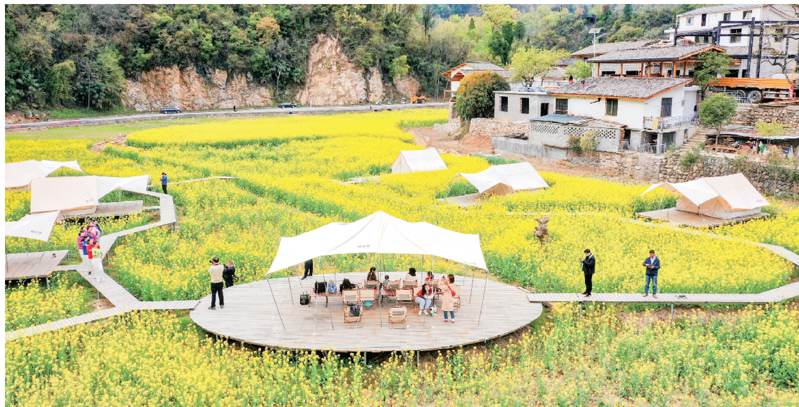
宁陕县城关镇渔湾村走出了一条村企共建共融共富、人与自然和谐共生的乡村振兴新路径，吸引大量游客前来观光旅游。