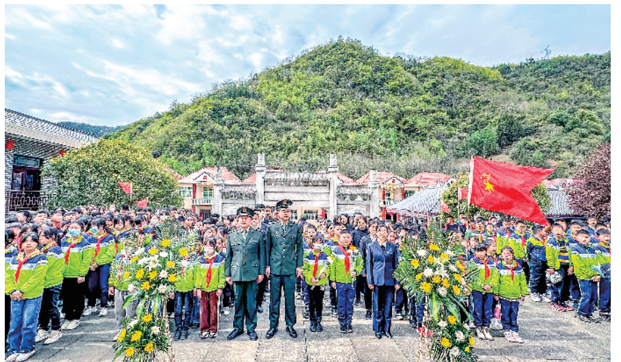
近日,旬阳市人武部联合红军镇中心学校师生前往红军纪念馆、核工业精神纪念馆,共同开展“缅怀革命先烈 传承红色基因”主题教育活动。