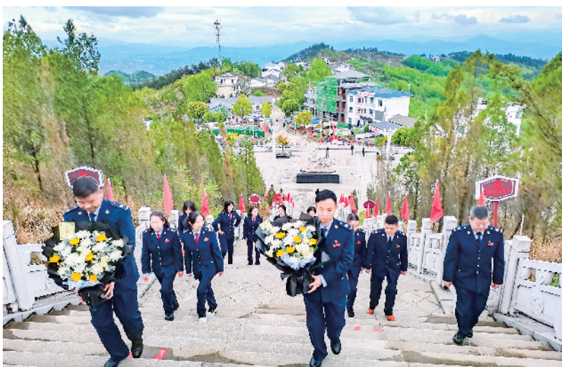
汉滨区税务局日前组织党员干部前往牛蹄岭战役遗址公园开展“缅怀革命先烈 弘扬爱国精神”清明节主题活动。