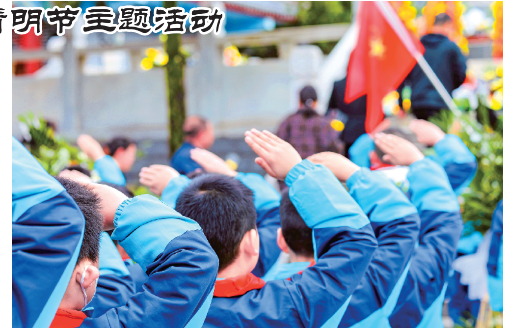
安康市第一小学四年级11班少先队中队开展了清明祭扫暨爱国主义教育研学活动。