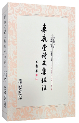
《张补山诗文集校注》

全书收录晚清安徽著名学者张鹏飞诗稿3卷，收诗272首；文集包括：卷首、文集8卷及附录，其中卷首收录的地方政府推荐张补山获得政府荣誉的各类公文、文集收录文章124篇，文集中奏疏信函及文告54篇，序跋37篇，碑记散文23篇，传表6篇，考据4篇。别集主要是他编撰的实用书籍，如《救荒三策》《野菜谱》之类。