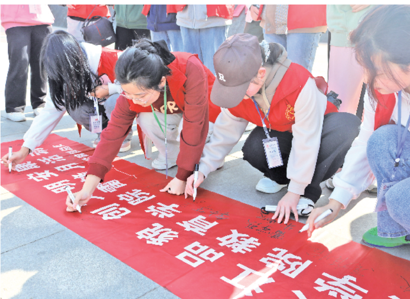
3月5日上午，安康学院20余名志愿者开展“塑汉江风貌 创文明安康”志愿服务活动。志愿者们向沿途市民朋友宣讲环保知识，倡导市民做文明安康人，共创文明城市。