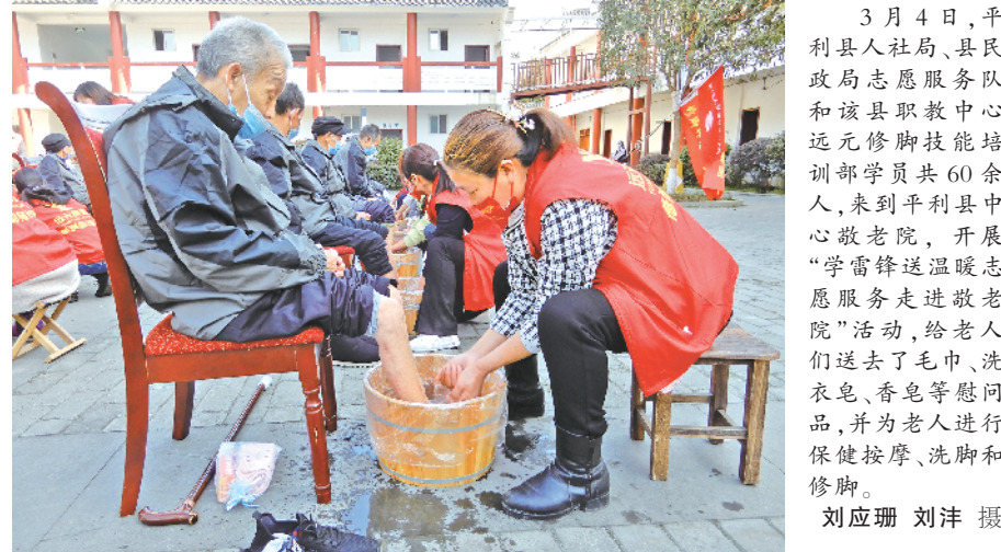
3月4日，平利县人社局、县民政局志愿服务队和该县职教中心远元修脚技能培训部学员共60余人，来到平利县中心敬老院，开展“学雷锋送温暖 志愿服务走进敬老院”活动，给老人们送去了毛巾、洗衣皂、香皂等慰问品，并为老人进行保健按摩、洗脚和修脚。