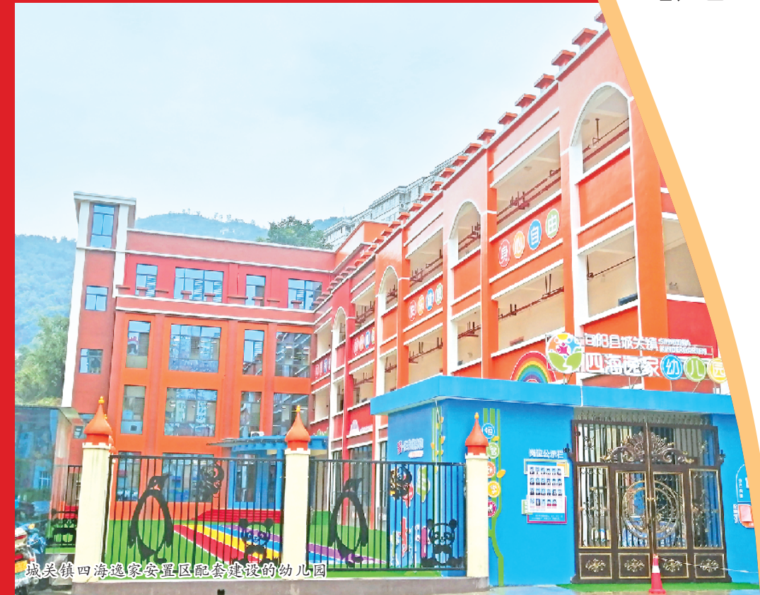
城关镇四海逸家安置区配套建设的幼儿园