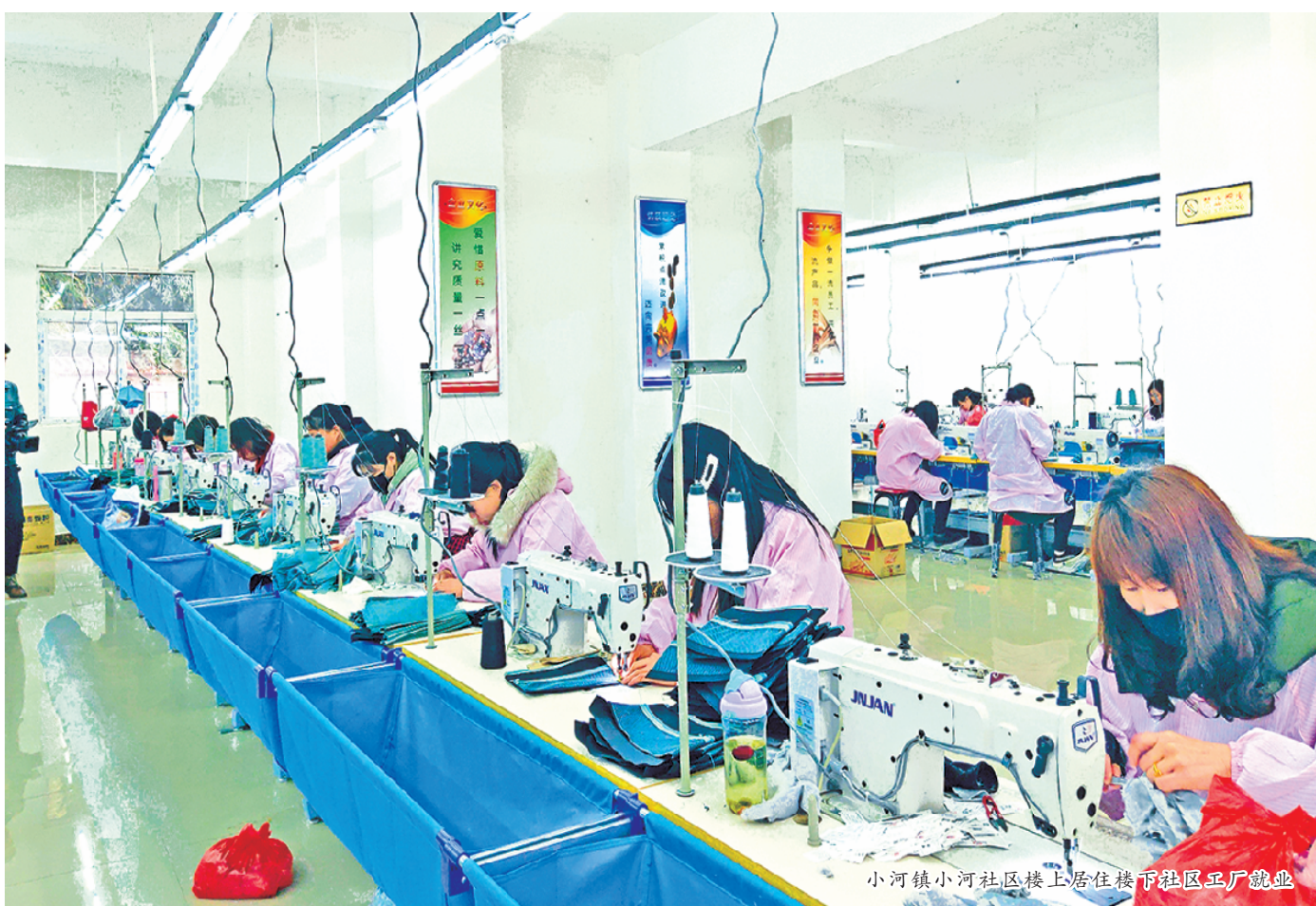
小河镇小河社区楼上居住楼下社区工厂就业

易地搬迁是解决一方水土养育不了一方人、实现困难群众跨越式发展的根本途径。故土难离，是中国几千年割舍不下的家园情结。这种矛盾是当前易地搬迁后续扶持发展工作的主要矛盾。 “十三五”期间，旬阳市共建集中安置点(小区)93个，累计实施易地扶贫搬迁13630户42653人。如此庞大的搬迁群体，如何让群众搬离故土在新的“天地”稳下来?安置点上的群众来自四面八方，人员结构复杂、居民需求多、管理服务难，如何统筹治理?群众入住、生活、就业、上学、求医及后续保障工作如何实现一盘棋统筹解决?如何实现群众搬得出、稳得住、能致富，成为考验旬阳执政能力的关键。 旬阳市创新探索出“456”搬迁后扶新机制，即：打造“4心”示范社区，实施5大乐业工程，建立6大服务中心，让易地搬迁群众实现安居乐业，解除后顾之忧，精心续写易地搬迁后扶后半篇文章，守护搬迁群众从故土难离到安居乐业。