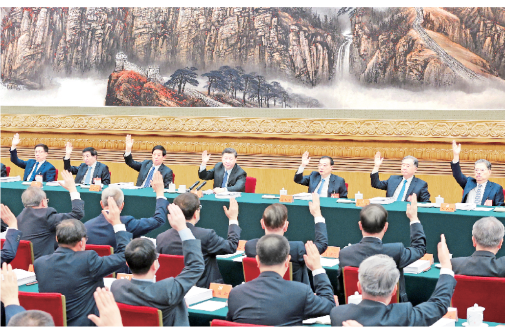
10月21日,中国共产党第二十次全国代表大会主席团在北京人民大会堂举行第三次会议。习近平、李克强、栗战书、汪洋、王沪宁、赵乐际、韩正等出席会议。

新华社北京10月21日电 中国共产党第二十次全国代表大会主席团21日上午在人民大会堂举行第三次会议,通过二十届中央委员会委员、候补委员和中央纪委委员候选人名单(草案),提交各代表团酝酿。 习近平同志主持会议。 会议通过了经各代表团差额预选产生的二十届中央委员会委员、候补委员和中央纪委委员候选人名单(草案),决定将名单提交各代表团酝酿。 据了解,从10月19日开始,各代表团对十九届中央