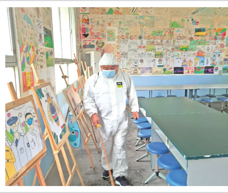
▲为减少疫情传播风险，近期，汉阴县经济技术开发区附属小学及时安排工作人员，对学生在校活动区域进行有效消毒，确保学生身心健康。

五一村美化庭院行动展现出的美丽乡村建设成果，是汉阴县城关镇推动乡村振兴的一个缩影。该镇将把美化庭院行动与农村人居环境整治有机结合，按照“试点先行、总结经验、全面建设”的思路，引导辖区村民家家参与、人人动手，通过卫生整治、拆除违建、拔除杂草、设立栅栏、建设文化墙、增设花草盆栽等方式提升乡村风貌，打造人文汉阴、魅力城关的靓丽风景。