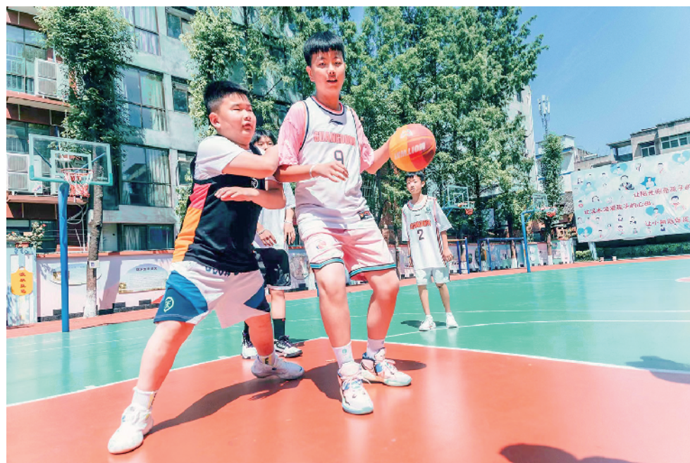
校园篮球持续火爆，学生在老师的指导下进行训练。