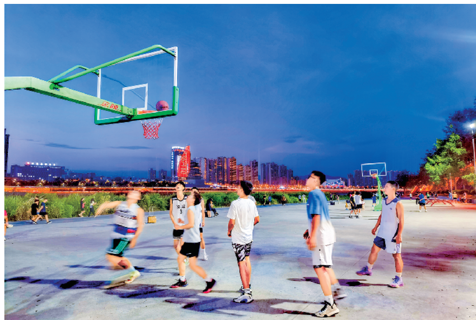
太阳刚刚下山，河边的篮球场就被打球的人早早填满，吹着河风打着球，体育和风景融为一体。