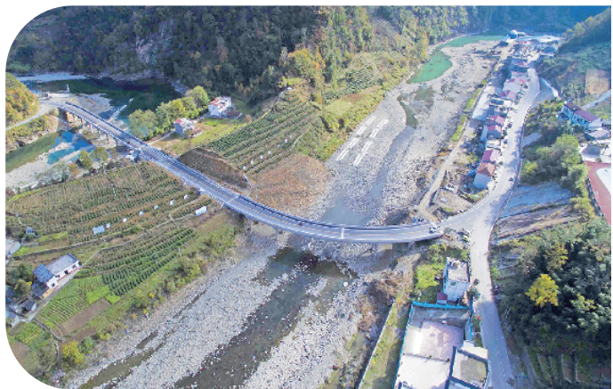
镇坪县平镇二级公路