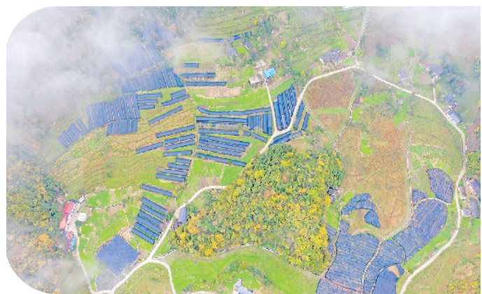
华坪镇尖山坪村杨家湾产业路