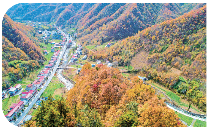
上竹镇庙坝村通村公路