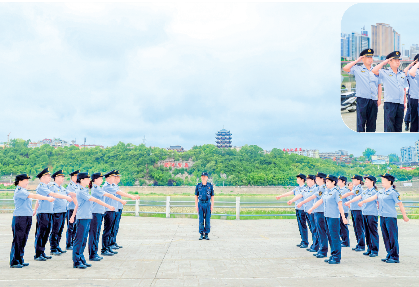
7月6日，汉滨区农业农村局组织执法人员，开展军事化队列训练，提升执法队伍的整体素质和能力水平，以新面貌、新形象为创建全国文明城市贡献力量。

据了解，襄阳市将此次活动作为7月份党支部主题党日活动的重要内容，以主题党日的仪式感，强化政治教育、党性锤炼，引导广大党员时刻增强党性意识，激励党员干部奋进新征程、建功新时代。