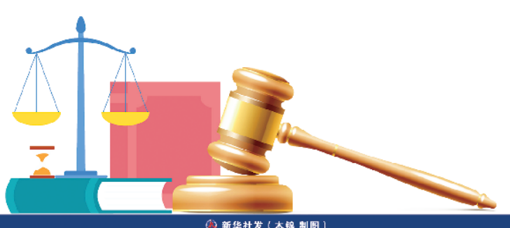
新华社发（木铎 制图）