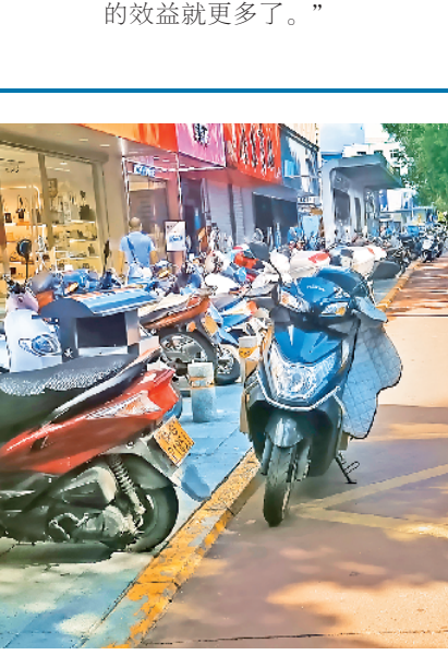
↑ 6月22日,安康中心城区金州南路,行人横穿马路,不走斑马线。 6月23日,金州南路东侧,摩托车、电动车停放在公交港湾,存在安全隐患。