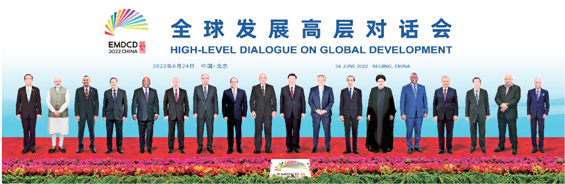
6月24日晚，国家主席习近平在北京以视频方式主持全球发展高层对话会并发表题为《构建高质量伙伴关系 共创全球发展新时代》的重要讲话。