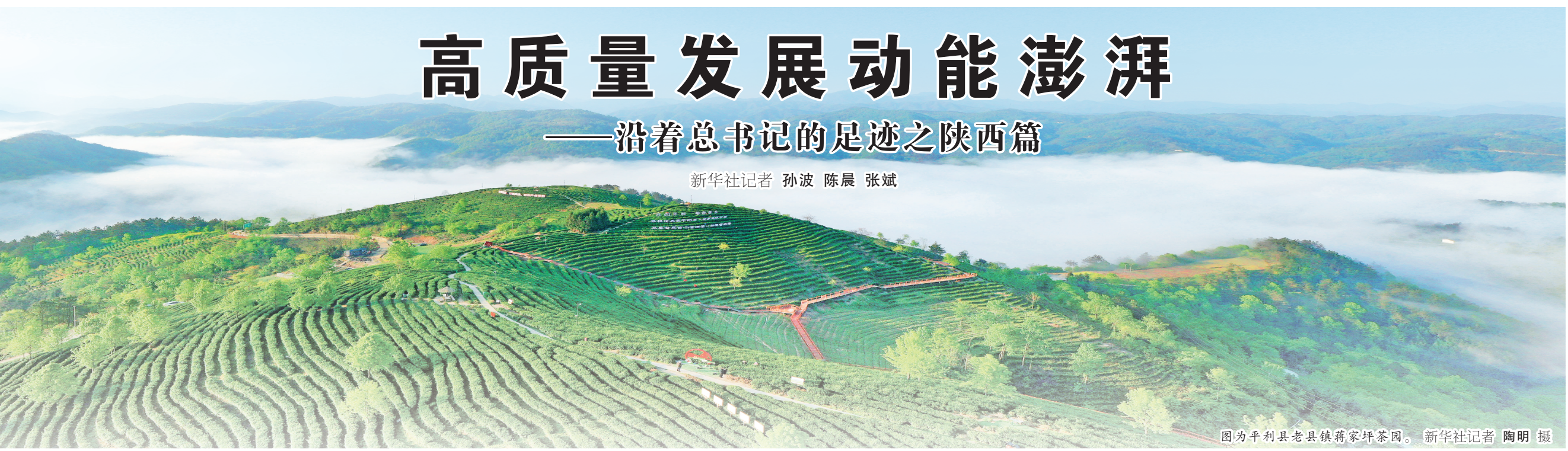
图为平利县老县镇蒋家坪茶园。

党的十八大以来，习近平总书记多次赴陕西考察，为陕西擘画发展蓝图。沿着总书记指引的方向，三秦儿女凝心聚力、团结奋进，弘扬光荣革命传统，更好服务和融入新发展格局，谱写陕西高质量发展新篇章。