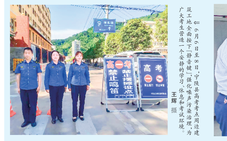
6月5日至6日,宁陕县高考考点周边,建筑工地全面按下“静音键”,强化噪声污染防治,为广大考生营造一个安静的学习、休息和考试环境。