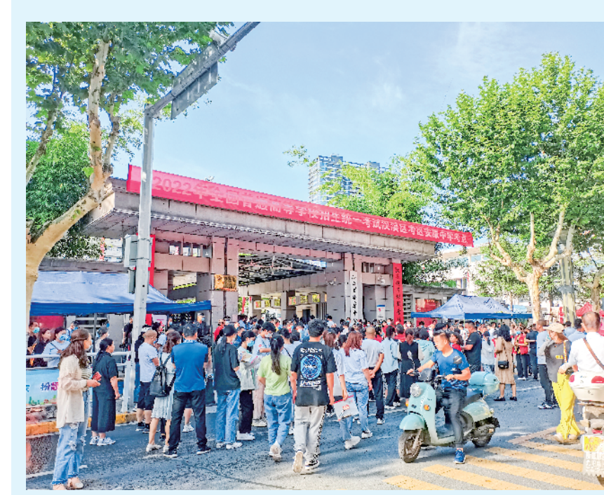
6月7日上午,在安康中心城区安康中学考点,考生家长等候在考点外翘首以盼考生出场。