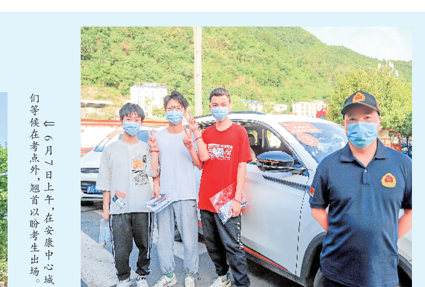
岚皋县退役军人组织40余名志愿者参加“爱心送考”活动。