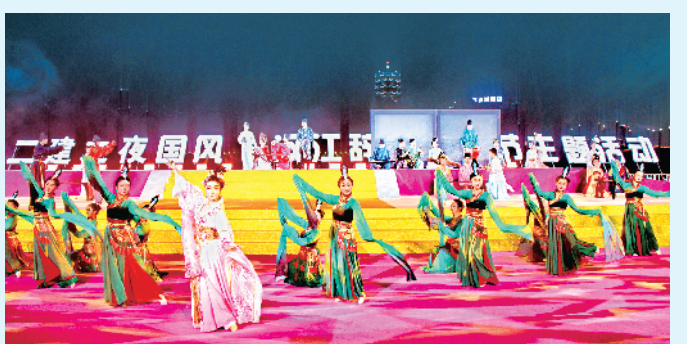
情景诗画《南有嘉鱼》