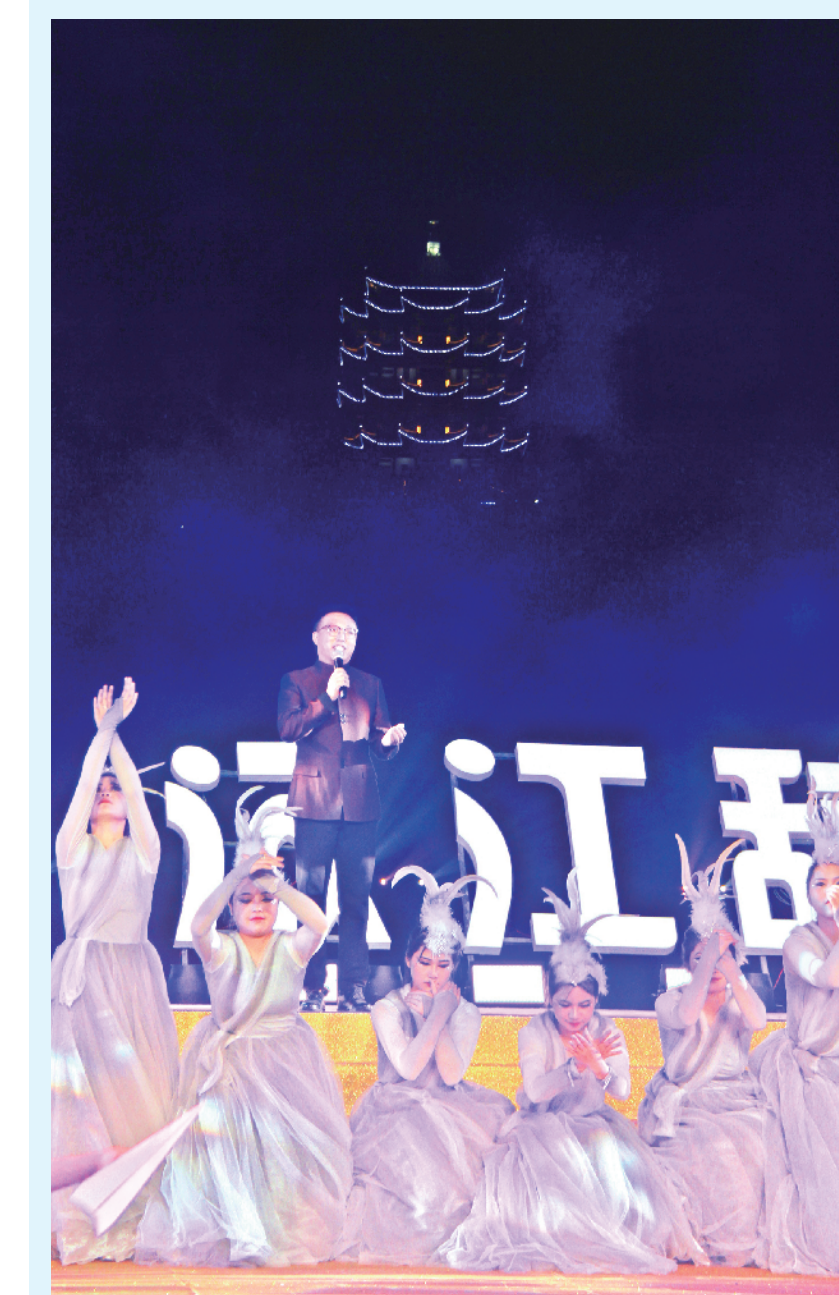
情景诗画《安康、安康》

据了解,本届中国安康汉江龙舟节夜间演出于6月3日、4日连续两天在龙舟文化园精彩上演。此次夜间演出活动利用龙舟节主题活动舞台,以“一江两岸”优美夜景为背景,通过声光电现代科技手段和精品节目为依托,突出“端午安康”主题,地域文化、节庆惠民等诸多元素的同时,进一步丰富龙舟节主题活动的内涵和外延。