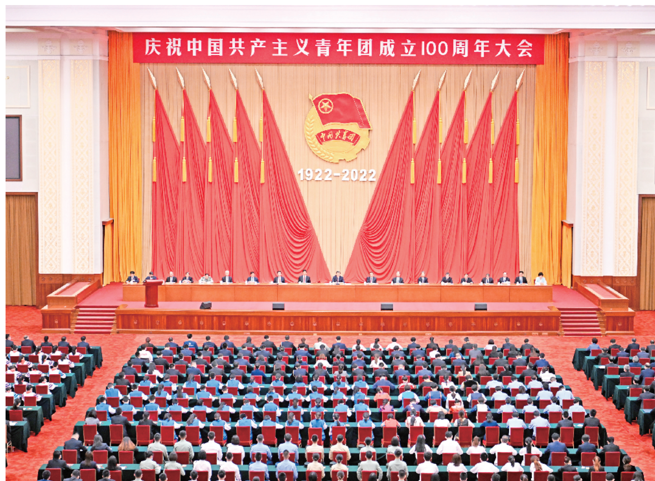
5月10日，庆祝中国共产主义青年团成立100周年大会在北京人民大会堂隆重举行。

新华社北京5月10日电 庆祝中国共产主义青年团成立100周年大会10日上午在北京人民大会堂隆重举行。中共中央总书记、国家主席、中央军委主席习近平在会上发表重要讲话强调，青春孕育无限希望，青年创造美好明天。新时代的中国青年，生逢其时、重任在肩，施展才干的舞台无比广阔，实现梦想的前景无比光明。实现中国梦是一场历史接力赛，当代青年要在实现民族复兴的赛道上奋勇争先。共青团要牢牢把握培养社会主义建设者和接班人的根本任务，坚持为党育人、自觉担当尽责、心系广大青年、勇于自我革命，团结带领广大团员青年成长为有理想、敢担当、能吃苦、肯奋斗的新时代好青年，用青春的能动力和创造力激荡起民族复兴的澎湃春潮，用青春智慧和汗水打拼出一个更加美好的中国。