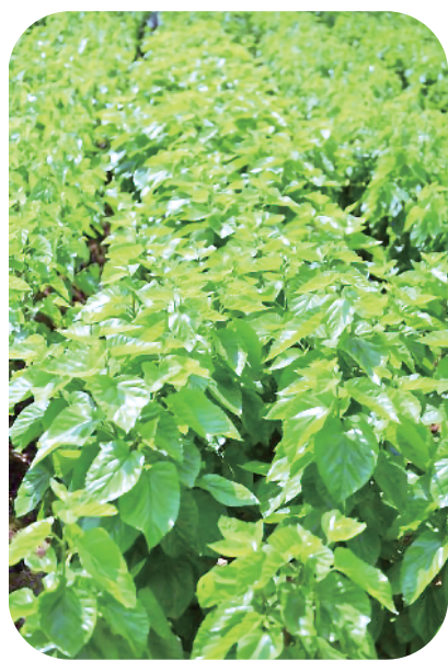
▲汉滨区的桑树园。林俊礼 摄

安康市石泉县是鎏金铜蚕的故乡，是西北蚕桑产业第一大县。2018 年被中国蚕业学会授予“中国蚕桑之乡”称号。现在该县蚕桑丝绸产业更是一派生机勃勃、欣欣向荣的繁荣景象。已经建成或正在建设中的蚕桑旅游观光园区、蚕桑丝绸文化园区、蚕桑副产品开发园区、织绸印染工业园区，形成了种桑、养蚕、织绸、副产品开发、产品交易、旅游观光、科普教育于一体的集约化发展新路径，古老的蚕桑产业赋予了新的丰富内涵和无限活力，创造性地避开了一条安康蚕桑丝绸产业发展的康庄大道。 站在新的百年征程起点上，《安康市“十四五”蚕桑产业发展规划》已发布，蚕桑产业高质量发展的蓝图已绘就。主要目标是：纳入乡村振兴统筹发展，到 2025 年全市建设国家级蚕良种繁育基地 1 个，蚕桑产业示范园区 100 个，高效桑园 20 万亩，丝绸产品商贸中心 1 个，实现种桑养蚕规模化、丝绸生产智能化、综合开发一体化、产业融合特色化的全方位立体格局，蚕桑产业年综合产值超过 50 亿元，由蚕桑产业大市转变为蚕桑产业强市。