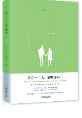
《总有一个人，温暖你远方》