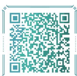
(阅读《入伍》请扫二维码)

《入伍》深刻揭示了人性善与人性美被赋予的价值，它不高贵也不华丽，它产生于平凡中，来自芸芸众生，但它质地厚重，色泽素朴，有着持久的永不磨灭清芬。单二狗一个来自秦岭以北的农村娃，他怀揣着一个普通军人的梦想，在藏北高原履行一个军人的使命，他的牺牲是人性与道义胜利，他的付出与奉献，其价值远远超越了一个军人的职责。在人生的两难选择中，单二狗的牺牲实在回答了一个哲学命题——生命重于泰山，道义即是担当！