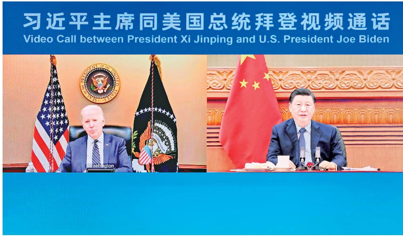
3月18日晚，国家主席习近平在北京应约同美国总统拜登视频通话。