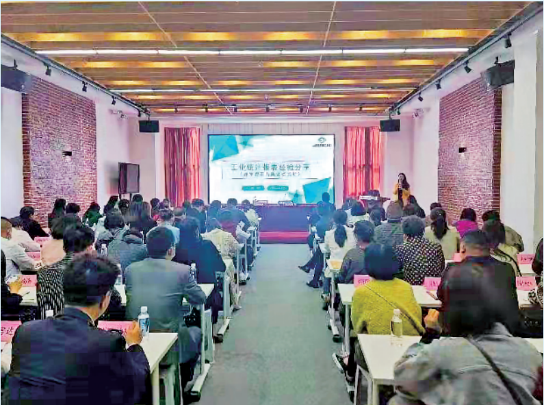
组织开展高新技术企业认定和科技型中小企业培育工作会