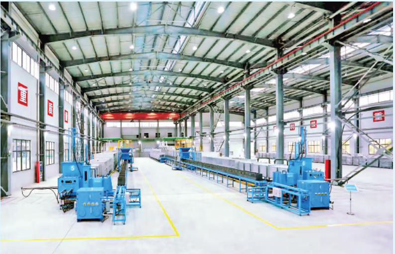
华银科技钒氮合金生产车间