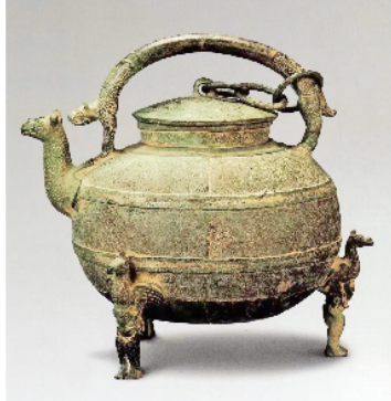
夔龙纹铜虎把提梁铜盃,1978年出土于安康市。高23.2厘米,重3.145千克,直口、球腹、圜底、虎形提梁,有盖,盖与提梁以三联环相连。三足与流的造型宛若一张弓,弧度柔和,空间适当,完美发挥了提梁的作用,握提在手非常方便,集装饰与功能为一体。

周明丽 在文物里,虎的形象,既可以威武神勇,也可以可爱呆萌。当爱宠铜盃出现在我眼前,不禁让我为古人天马行空的艺术构思发出一声赞叹:百兽之王老虎竟可以化身为“盃”上的提梁,确为神来之笔! 东汉许慎在《说文解字》里有言:“盃,调味也。从皿,𠬞声。”王国维在《说盃》中说:“余谓盃者,盖和水于酒之器,所以节酒之厚薄也。”可见盃是古代酒器,是用来调和米酒,加水来冲兑酒味浓浓的。从考古发现看,多分布于山西、陕西、河南、江苏、安徽等地,尤以江淮地区分布最多。西周中期以后,盃常与盃共出,说明盃的功能有所转变,从酒器变为水器,不论作为酒器还是水器,“盃”与人们的日常生活总是密切相关,它是“茶壶”的鼻祖,现代用的茶壶即是由它发展而来。 夔龙纹铜虎把提梁铜盃,1978年出土于安康市。高23.2厘米,重3.145千克,直口、球腹、圜底、虎形提梁,有盖,盖与提梁以三联环相连。三足与流的造型宛若一张弓,弧度柔和,空间适当,完美发挥了提梁的作用,握提在手非常方便,集装饰与功能为一体。 安康曾为秦、楚、巴等国反复争夺之地,文化既有师承中原文化的一面,又有浓郁的地方特色。秦人的豪爽,楚人的灵秀,巴人的彪悍,杂糅相应,点燃了安康文明多彩的火花。虎形提梁的出现,再次印证了虎在古人眼中的地位,它不似氏族图腾那般神秘莫测,不似虎踞龙盘那般雄健,只是化为提梁成为日常生活最烟火气的那一部分。夔龙纹铜虎把提梁铜盃见证了多少文人雅士词作赋的豪迈,见证了历经悠悠多个民族的文化交融,是安康秦人楚士蜀凤之说的见证,又历经悠悠岁月,有幸被陕西历史博物馆珍藏,成为研究秦巴地区各民族文化交流的重要实物资料,静静等待着观众走近欣赏。