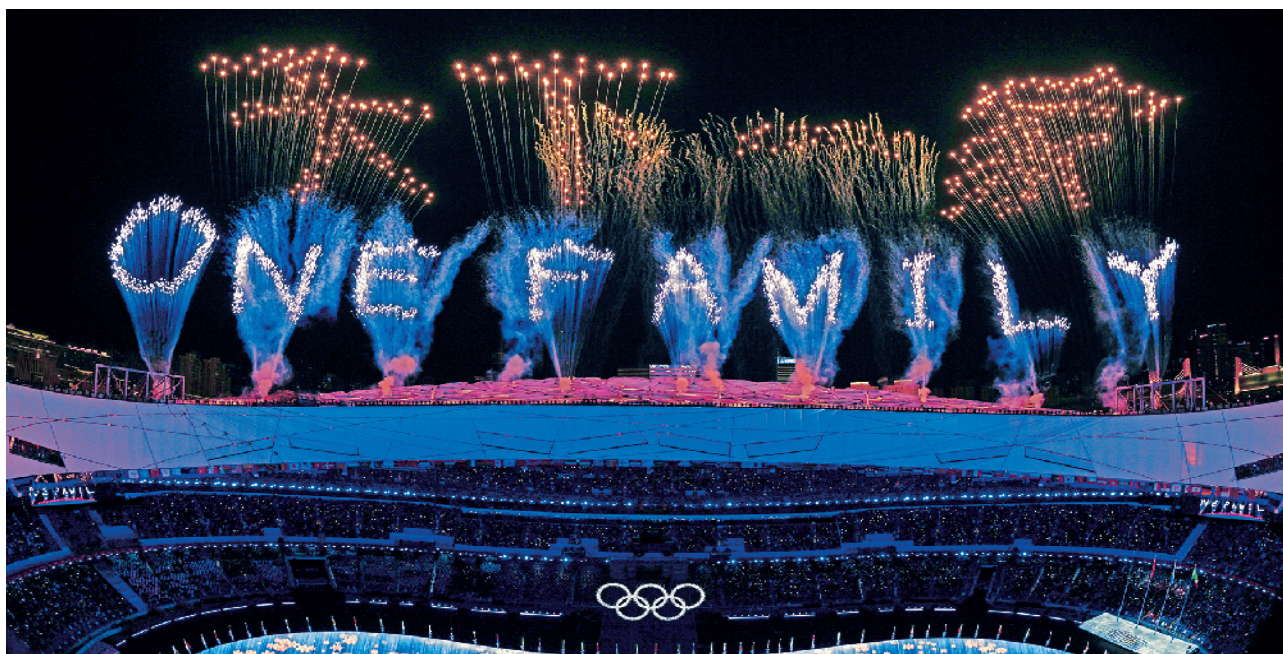
2月20日晚,北京第二十四届冬季奥林匹克运动会闭幕式在国家体育场举行。这是焰火在“鸟巢”上空显示出中文“天下一家”和英文“ONE FAMILY”字样。