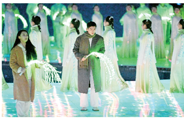
2月20日晚,北京第二十四届冬季奥林匹克运动会闭幕式在国家体育场举行。这是“折柳寄情”环节。