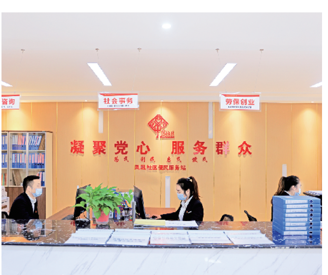
便民服务中心,打通服务群众最后一公里。

万元,实现园区周边农户户均增收4000余元,通过集聚资源引龙头、集中流转稳预期、集约经营增效益,从根本上遏止了试点区域土地撂荒现象。