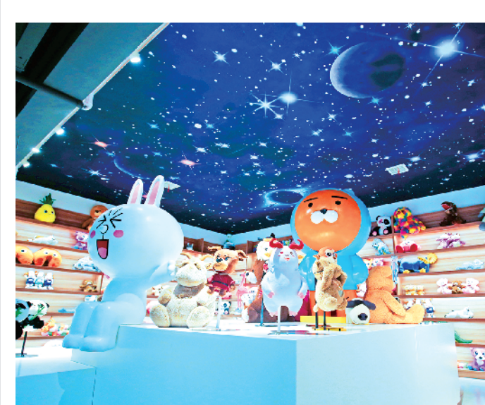
毛绒玩具“五大中心”之产品展示中心。