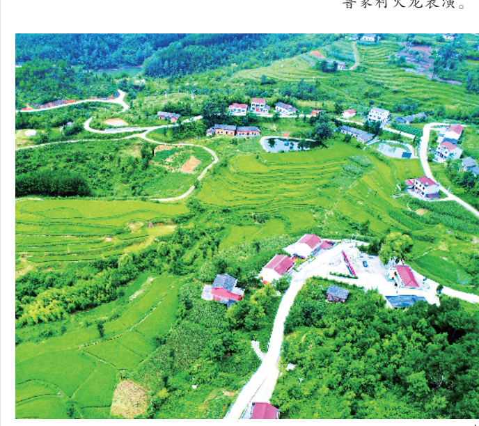
香山水利风景区优美画卷。