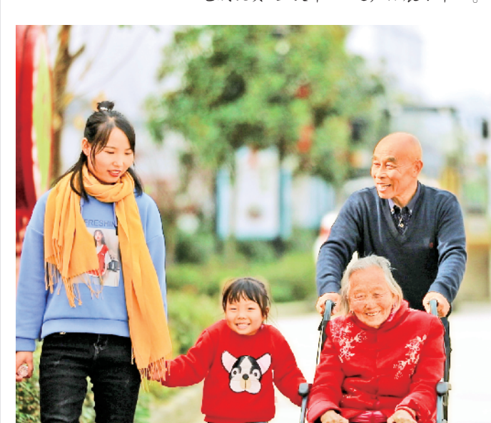
搬迁一批,幸福一批。