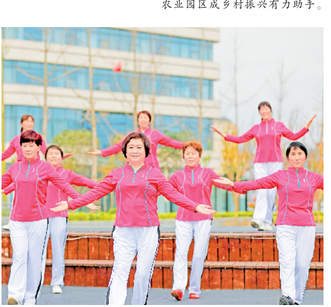
群众文化丰富多元。