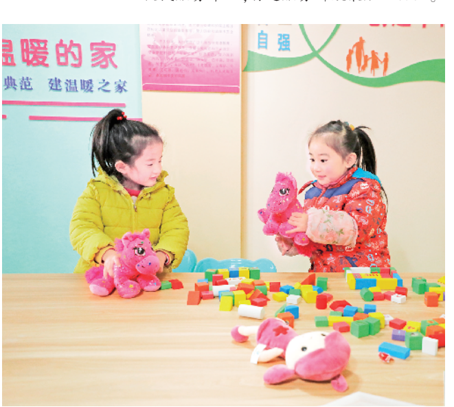
妇女儿童之家是留守人员温暖的家。

深入学习贯彻习近平新时代中国特色社会主义思想和十九届二中、三中、四中、五中、六中全会精神,聚焦巩固深化“不忘初心、牢记使命”主题教育成果,高质量推进党史学习教育,围绕“基础提升年”主题,深化实践党建工作直管到村工作机制,持续实施党建引领“三个三”工程。圆满完成了村(社区)“两委”及恒口镇党委、人大、政府换届工作,对换届后的96个村(社区)党组织书记进行备案管理并开展集中培训,对全区16个机关党支部全面开展“模范机关”创建和“灯下黑”问题专项整治。依托扁平化管理优势,整合村级监委力量,单履职、按单监督,不断提升监督的精准性、实效性,切实把制度优势转化为治理效能,推动监督下沉、监督落地。