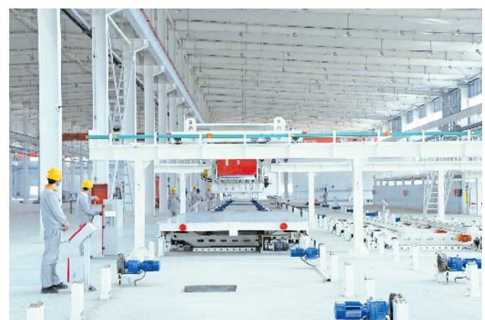
五里工业集中区陕建集团PC项目车间一角