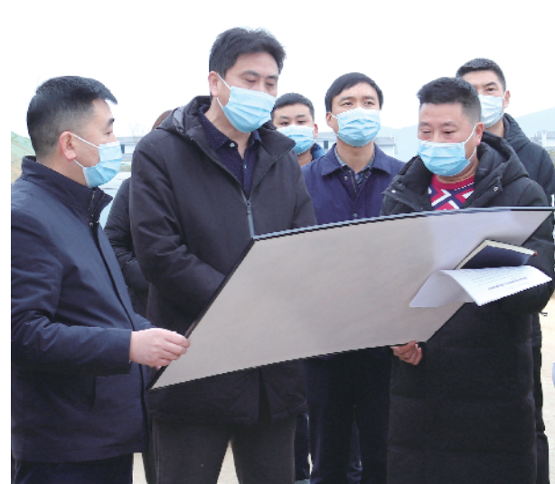
区委副书记、代区长吴大林调研城东新区建设