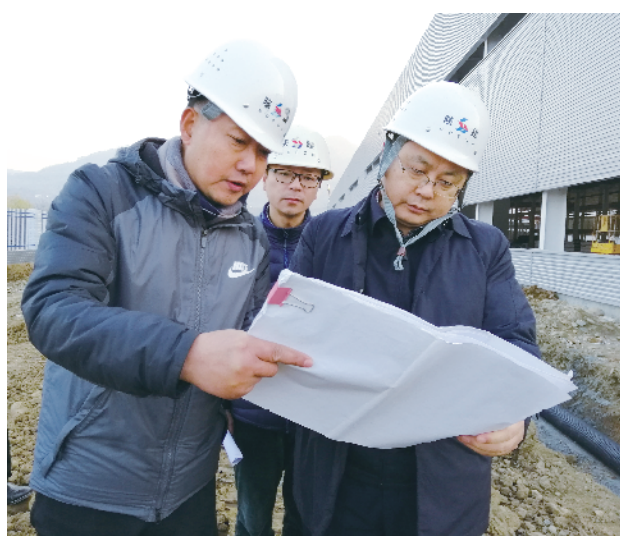
区委书记范传斌在陕建装配式建材PC构件项目现场调研