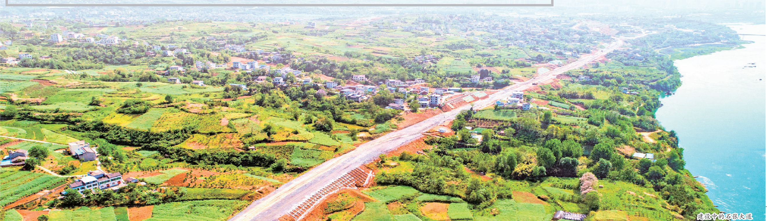
建设中的石张大道

引项目、强服务、促开工，汉滨区的项目建设在这个冰天雪地的冬季，没有停下脚步，而是绕开季节的影响，跑出了“加速度”。截至目前，2021年新开工招商引资项目76个，其中投资亿元以上项目占到38%。2021年完成省际到位资金110亿元，占目标任务的109%；实际利用外资627万美元，占目标任务的104.5%。