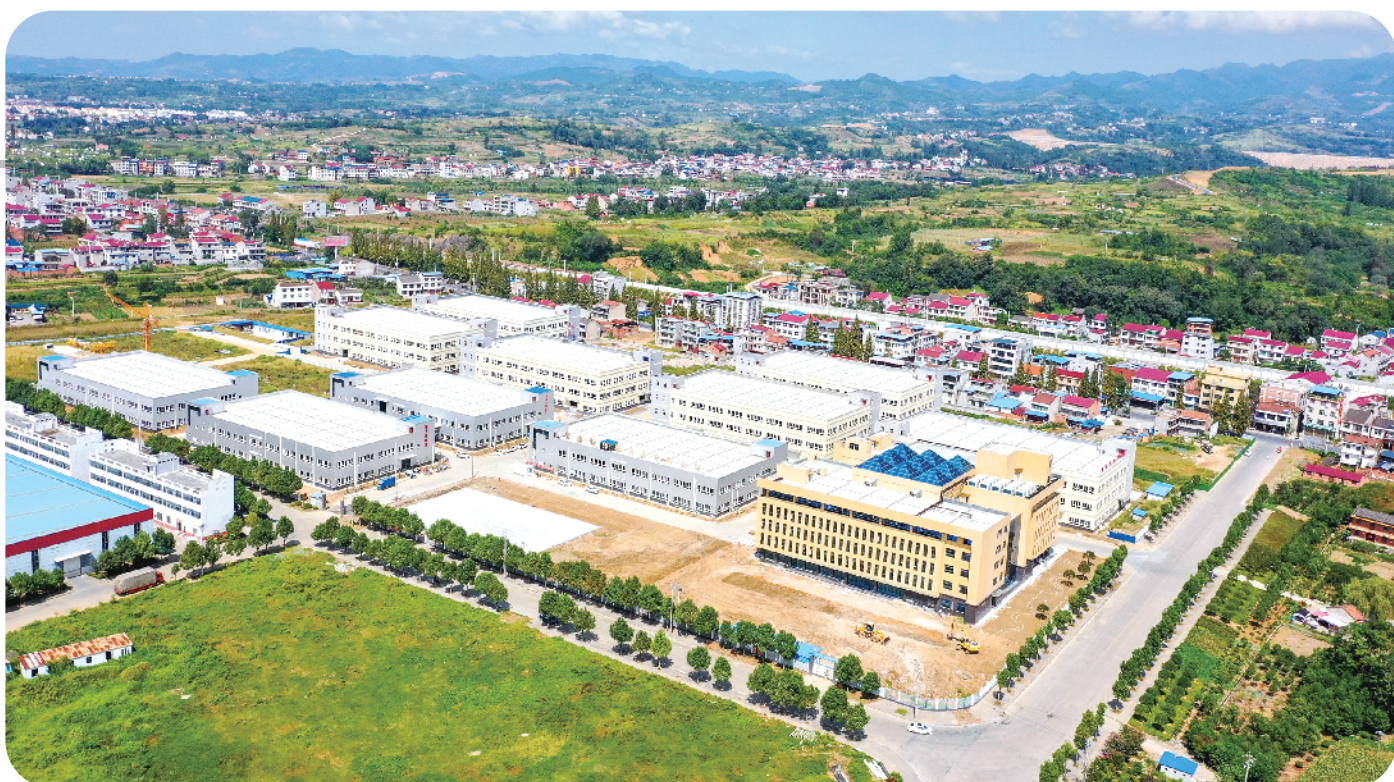
五里工业园区社区工厂总部