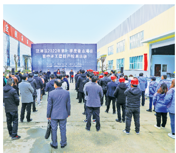
2022年第一季度项目开工现场