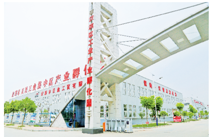
五里工业集中区一角