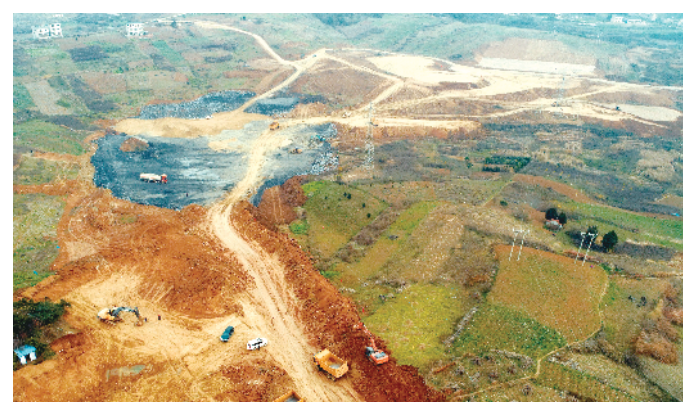
建设中的城东新区秦巴路