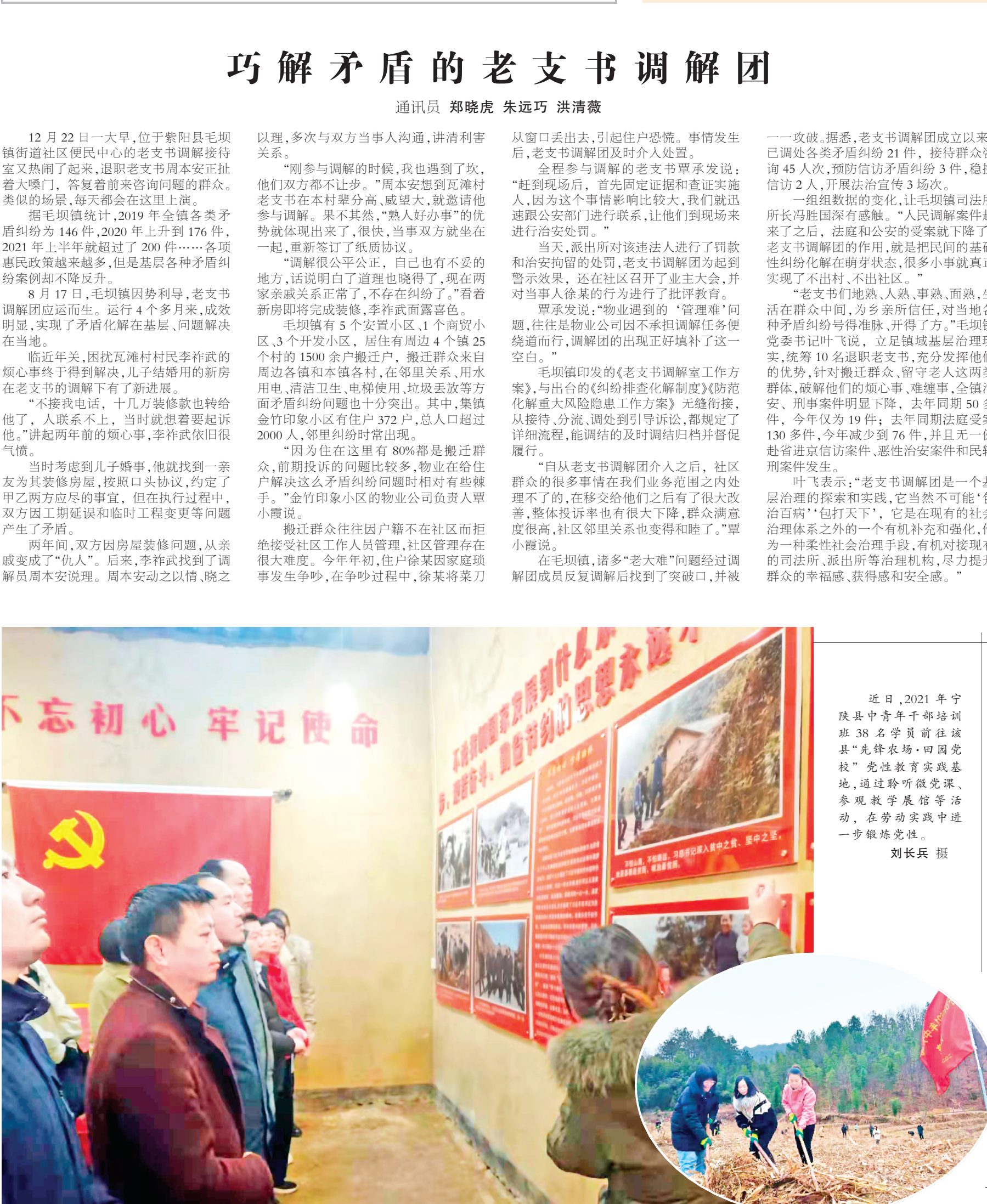
近日,2021年宁陕县中青年干部培训班38名学员前往该县“先锋农场·田园党校”党性教育实践基地,通过聆听微党课、参观教学展馆等活动,在劳动实践中进一步锻炼党性。