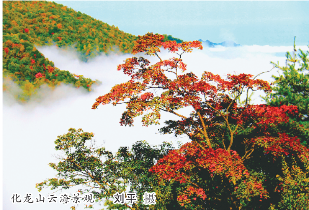
化龙山云海景观