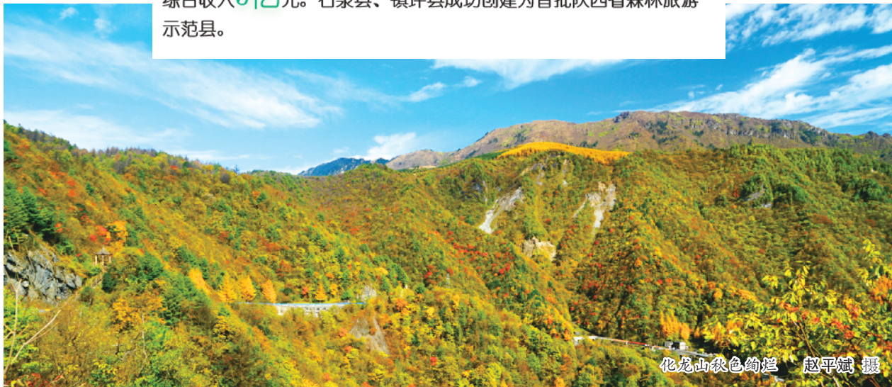
化龙山秋色绚烂

2020年，全市特色经济林总面积达到 925.34 万亩，实现林业总产值 212.04 亿元。启动建设山林经济示范园区 40 个，园区总数达到 438 个；全市的省级林业龙头企业达到 24 个、市级林业龙头企业达到 68 个；全市森林公园接待游客 280 万人次，实现旅游综合收入 5 亿元。石泉县、镇坪县成功创建为首批陕西省森林旅游示范县。