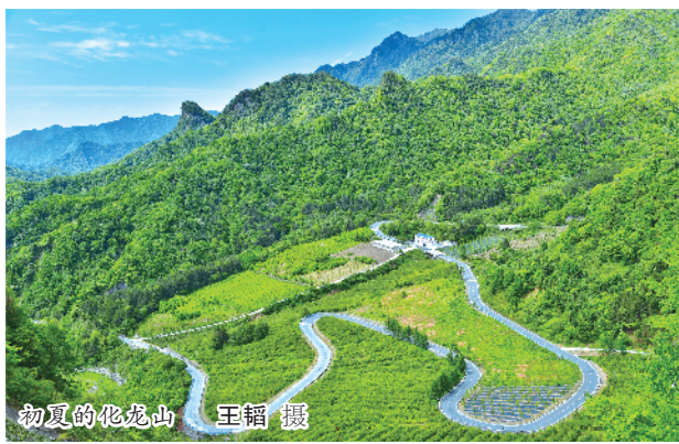
初夏的化龙山