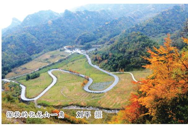
深秋的化龙山一角