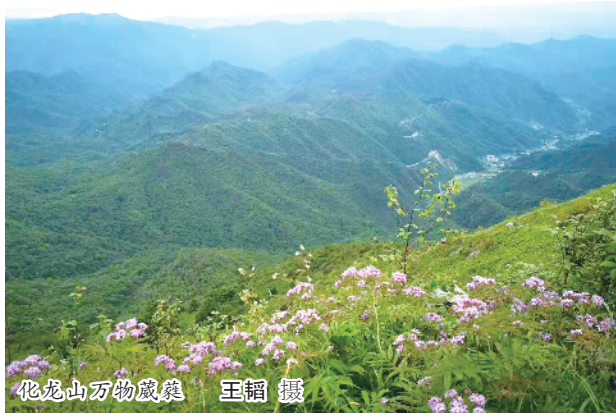
化龙山万物盛景

安康境内由我市直接管辖的各类自然保护地共有25个，批复总面积为12.37万公顷。其中自然保护区2个、国家级森林公园5个、省级森林公园7个、国家级湿地公园6个、风景名胜区3个、地质公园2个。除3处风景名胜区外，由我市直接管理负责的自然保护地数量由整合优化前的22处变为整合优化后的21处。