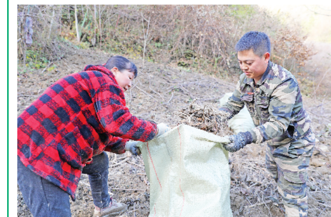
近日,位于平利县洛河镇的清水河中药材种植基地喜获丰收,预计本年度能够采收药材30吨,带动村民增收100余万元。图为村民抢抓晴好天气采收药材“独活”。 王隆/文