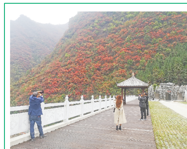
11月深秋季节,阜阳市水泉坪景区遍山红叶进入最佳观赏期,斑斓多彩的奇特景观吸引了大批游客和摄影爱好者。

收入占比相对稳定。前三季度,我市城镇居民、农村居民人均可支配收入绝对值分别为23320元、9971元,与全省城镇31052元、农村11070元的收入水平相比,占比分别达到75.1%、90.1%。与2020年前三季度城镇占比74.7%、农村占比90.2%的水平相比,我市城镇、农村居民收入绝对值相对稳定。城乡收入差距不断缩小。前三季度,我市农村居民人均可支配收入增速快于城镇2.6个百分点,城乡收入比为2.34:1,较上年同期缩小0.06,城乡收入之比不断缩小。居民生活消费快速恢复。前三季度,我市全体居民人均生活消费支出11664元,同比增长18.5%。其中,城镇居民人均生活消费支出14362元,增长15.0%;农村居民人均生活消费支出9676元,增长21.8%。