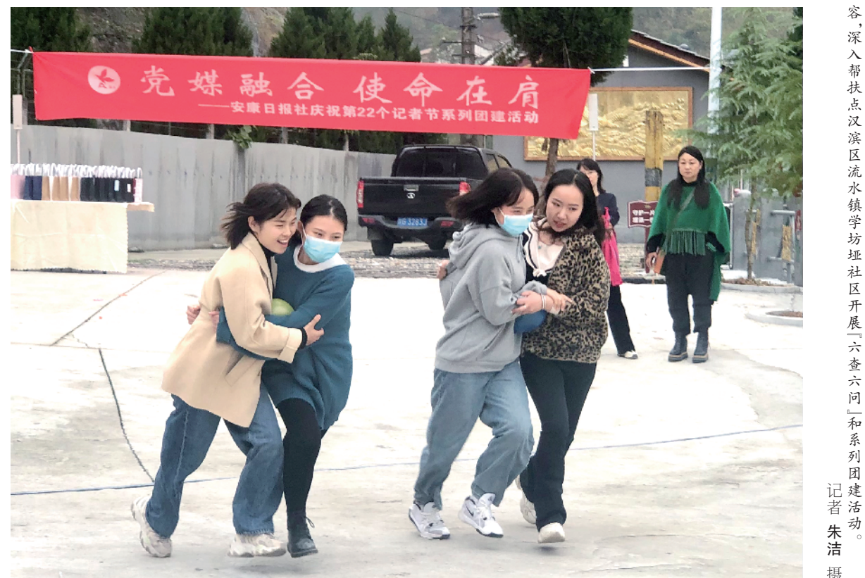
为庆祝第11个记者节，2月4日，安康日报社以“党媒创新服务在一线”为内容，深入帮扶点汉滨区流水镇学场社区开展“六查六问”和系列团建活动。

泳、女子S9级100米仰泳获得银牌；丁海霞在网球单上肢残疾站立组女团获得银牌。紫阳县王秋霞在女子VL2个人200米、500米获得银牌。岚皋县刘学润获得射箭W1级团体淘汰赛第二名，个人淘汰赛银牌；曾明奎在网球单上肢残疾站立组单上肢级别团体获得第二名。汉滨区宋安股在射击飞碟荣获SG-S级团体第二名。