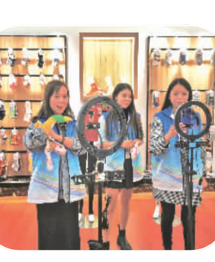
近日,在汉滨区五里工业集中区新乐祥袜业公司干净整洁的车间里面,智能袜机正有序作业,七彩纱线来回穿梭,编织出一双双款式新颖的袜子。而在附近的台升祥网络科技有限公司内,工作人员正在通过直播售卖袜子。据了解,新乐祥袜业公司是2020年汉滨区通过招商引资引进的一个袜业大企业,与韩国、日本等20多个国家有订单合作,带动300余人就业。