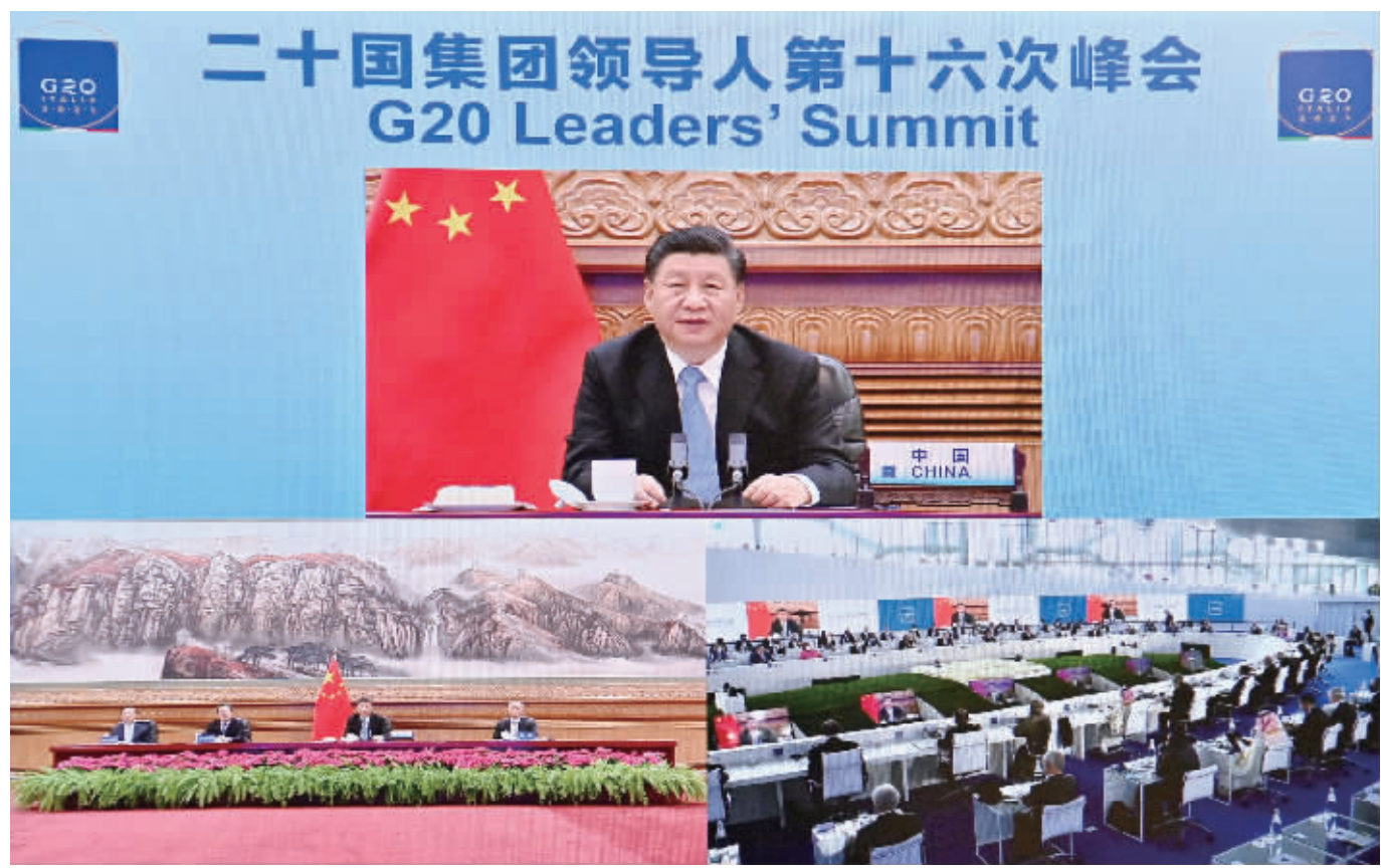
10月31日晚，国家主席习近平在北京继续以视频方式出席二十国集团领导人第十六次峰会。