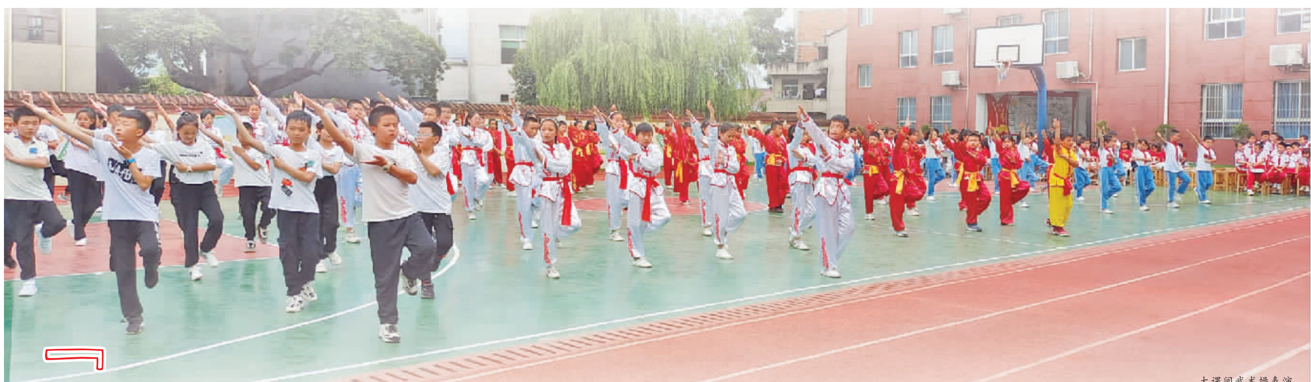
大课间武术操表演