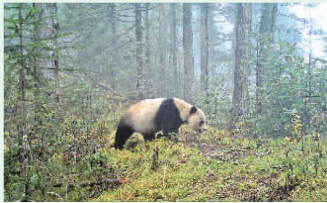
大熊猫国家公园甘肃白水江片区的红外相机拍摄到的野生大熊猫活动画面。

主 编 陈俊 执行主编 田丕 电 话 3268517 邮 箱 akrbkjzk@163.com