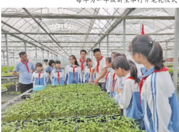
组织学生参加劳动基地实践活动