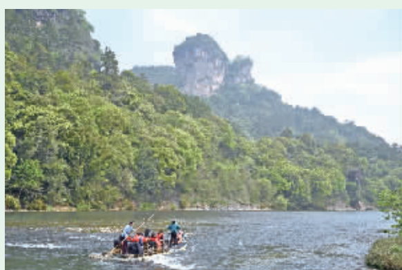
竹筏游览。 游客在武夷山国家公园九曲溪乘竹筏游览。