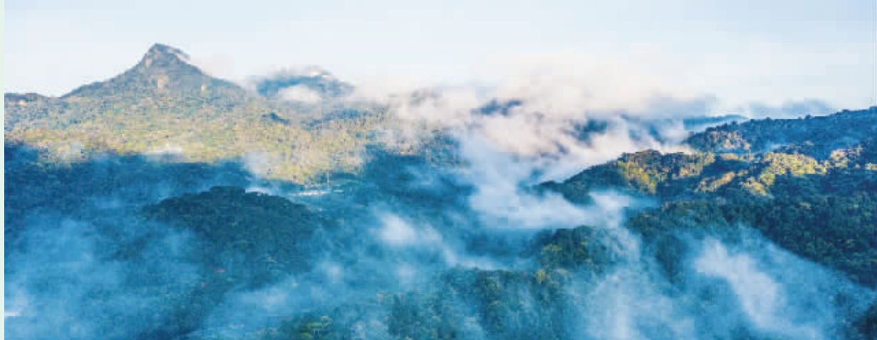
海南热带雨林国家公园尖峰岭片区风光。

中国国家公园是以保护具有国家代表性的自然生态系统为主要目的,实现自然资源科学保护和合理利用的特定陆地或海域。12日,国家主席习近平在以视频方式出席《生物多样性公约》第十五次缔约方大会领导人峰会并发表主旨讲话时指出,中国正式设立三江源、大熊猫、东北虎豹、海南热带雨林、武夷山等第一批国家公园,保护面积达23万平方公里,涵盖近30%的陆域国家重点保护野生动植物种类。