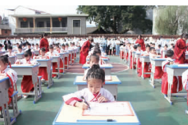
每年为一年级新生举行开笔礼仪式

如今,在巩固“一年大变样”建设成果的基础上,红星校区快速推进学校好的学风、校风建设,快速提升办学品质,在“三年有影响”的道路上努力前进。