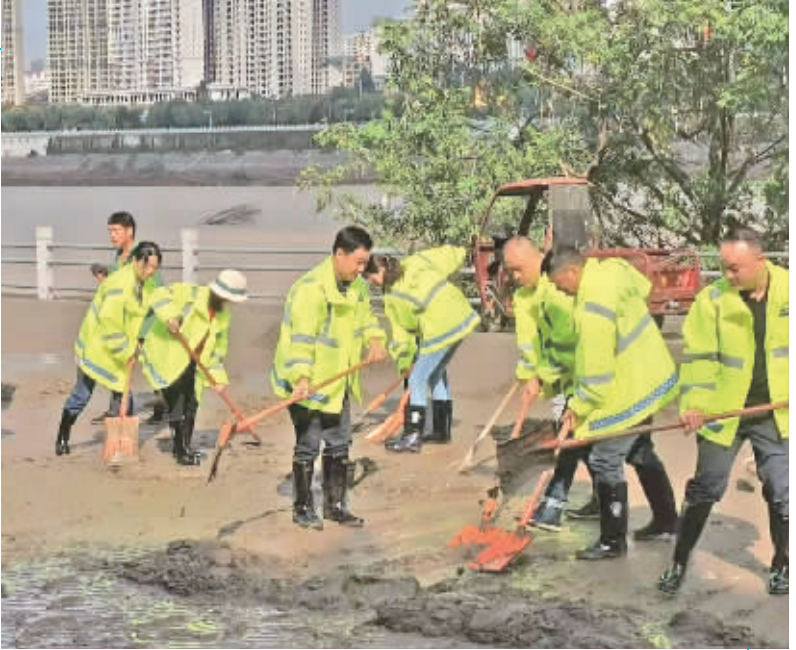
近日,我市又有一家中小学生学习实践教育基地——汇陕南花木大世界挂牌。据悉,汇陕南花木大世界占地170余亩,花卉品种众多,目前不仅是陕南最大的花卉市场,还是一座集展示、教研等多功能于一体的科普自然馆,是学生研学的好地方。