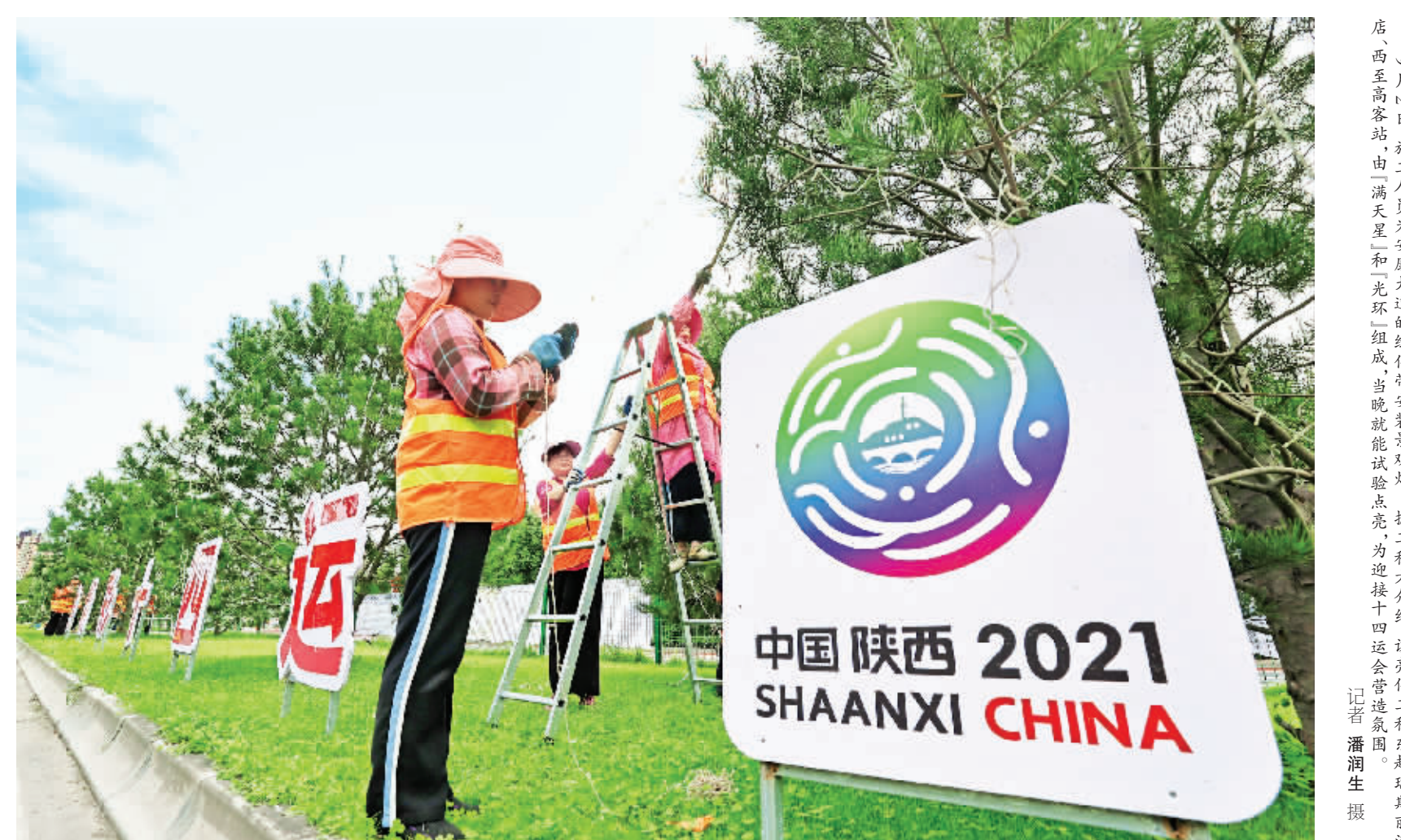
9月10日,施工方为安康大道的绿化带安装景观灯。据工程方介绍,该亮化工程东起瑞斯丽酒店,西至高客站,由“满天星”和“光环”组成,当晚就能点亮,为迎接十四运会营造氛围。