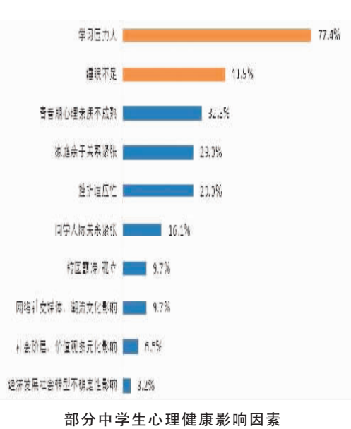
部分中学生心理健康影响因素