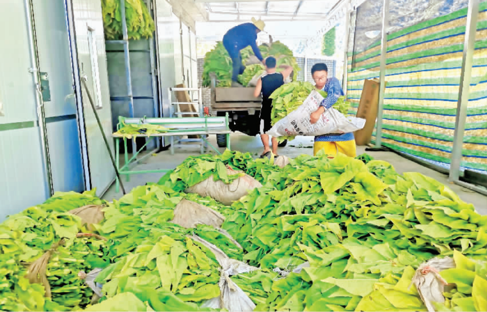
近日,在平利县正阳镇烤烟基地,村民正抢抓时令忙着采收烟叶。据悉,目前该镇共发展烤烟1000亩,不仅盘活了撂荒地,还有效巩固了脱贫攻坚成果。