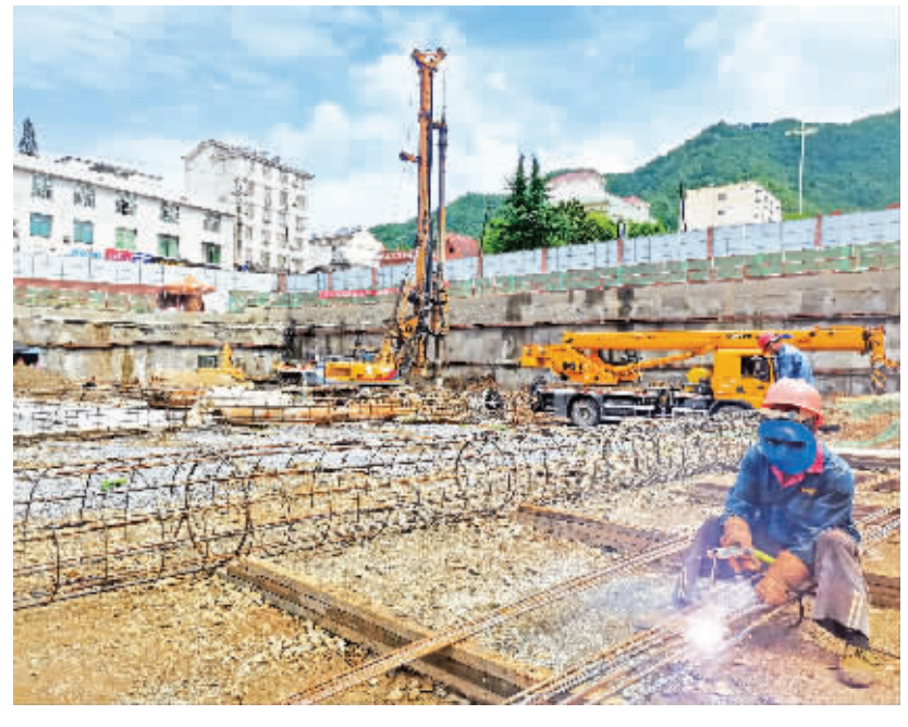
平利县级重点项目月城新世纪广场施工现场。