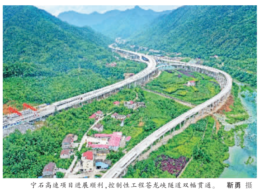
宁石高速项目进展顺利,控制性工程苍龙峡隧道双幅贯通。