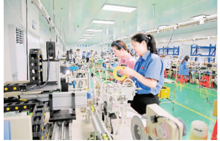
高新区电子磁性元件生产加工项目投产。