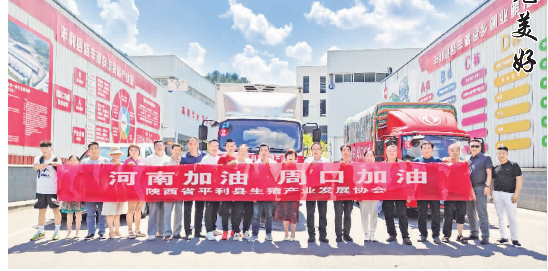
因为7月26日下午，平利县生猪产业协会驰援河南运送物资志愿小分队整装待发。