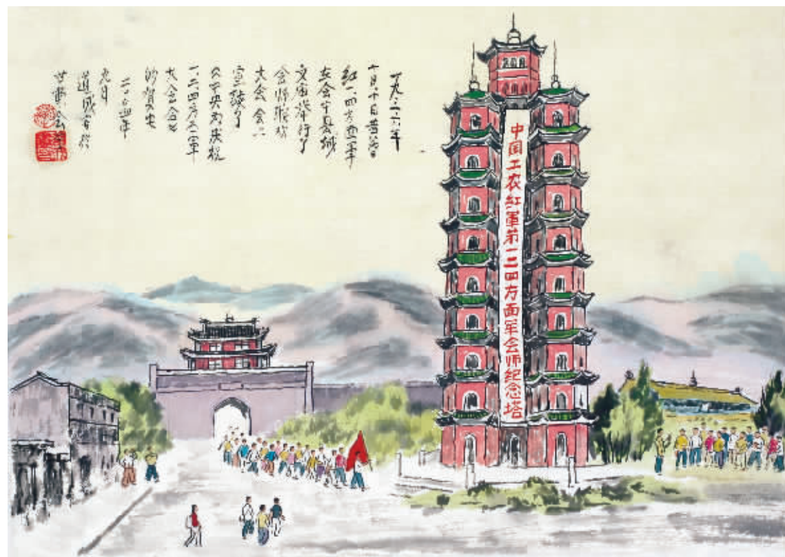
1936年10月6日,红四方面军指挥部到达甘肃会宁,同红一方面军会合。22日,红二方面军指挥部到达甘肃隆德将台堡,同红一方面军会合。至此,三大主力红军胜利会师。