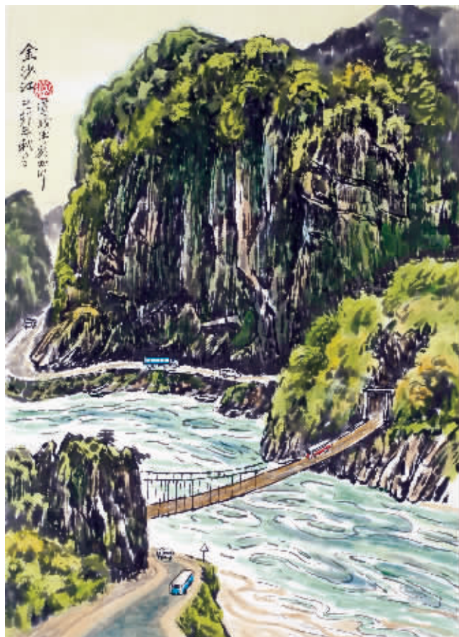
从1935年1月末开始,红军四渡赤水,南渡乌江,佯攻贵阳,奔袭云南,直逼昆明,又突然掉头向北,于5月上旬渡过金沙江,取得了战略转移中具有决定意义的胜利。