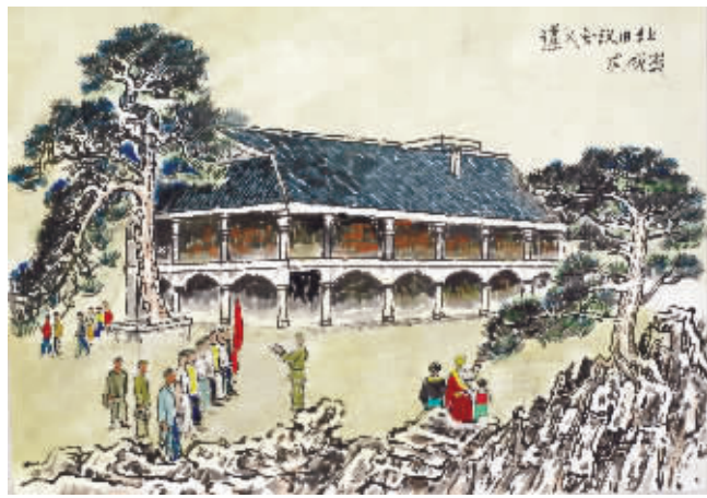
1935年1月,党中央在贵州遵义召开政治局扩大会议,事实上确立了毛泽东在党中央和红军的领导地位,这是党的历史上一个生死攸关的转折点。