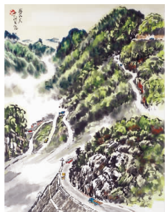
遵义会议后,中央红军经娄山关北上。渡长江未果,又折回再向遵义进军,途中经激战打败扼守娄山关的贵州军阀王家烈部一个师,乘胜重占遵义。