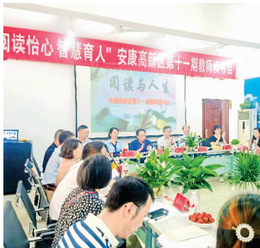
6月2日，主题为“阅读怡心，智慧育人”的高新区第十一届教师读书会活动在高新区河西九年制学校成功举办，线上线下共计200余名教师参加。此次活动提高了教师的综合素质，丰富了教学文化内涵。

该行将党史学习教育融入支行职工之家“建家”全过程，丰富和拓展了支行“建家”的内涵和外延。同时，将党史学习教育融入“我为群众办实事”实践活动中，组织开展县域金融工作联席会议，推进金融支持乡村振兴，落实“六稳”“六保”任务、防范化解金融风险等工作。梳理了82家县域重点企业，明确各家企业联系银行，实施“银行+企业”结对服务，确保信贷支持、金融服务精准滴灌。开展移动支付便民工程，创建移动支付无障碍商圈，围绕公交和出租车、餐饮等服务行业开展移动支付推广工作，支付服务覆盖全县所有行政村。