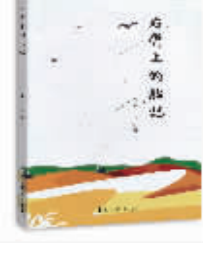
右臂上的胎记 姜华 著