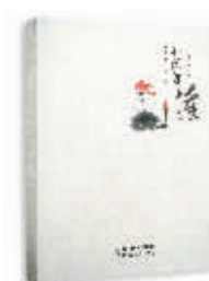
心静如莲 黄开林 著