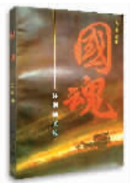
国魂 马建勋 著

在“二为”方向、“双百”方针指引下——人民文艺生命蓬勃不息。谨以安康“采薇”纪念《在延安文艺座谈会上的讲话》发表七十九周年。