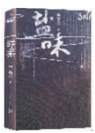
盐道三部曲 李春平 著