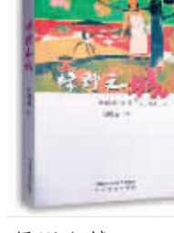
绿野之城 王晓云 著