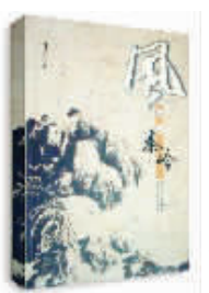
风吹过秦岭 刘云 著