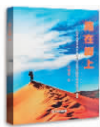
路在脚下 曾德强 著