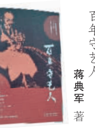
百年守艺人 蒋典军 著