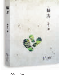
偏方 吴昌勇 著