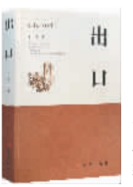
出口 张虹 著