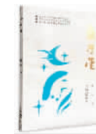
蓝星星 陈敏 著