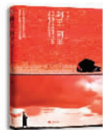
阿里阿里 杜文娟 著