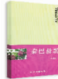
秦巴放歌 赵攀强 著