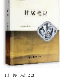
村居笔记 白明智 著