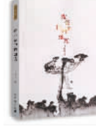
擦亮精神的烛光 叶松铨 著