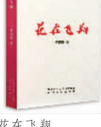
花在飞翔 李爱霞 著