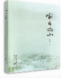
家在巴山 杜文涛 著