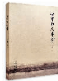
心中的太平河 刘建明 著