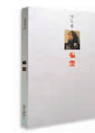
偏安 李小洛 著