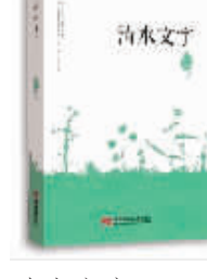
清水文字 温洁 著