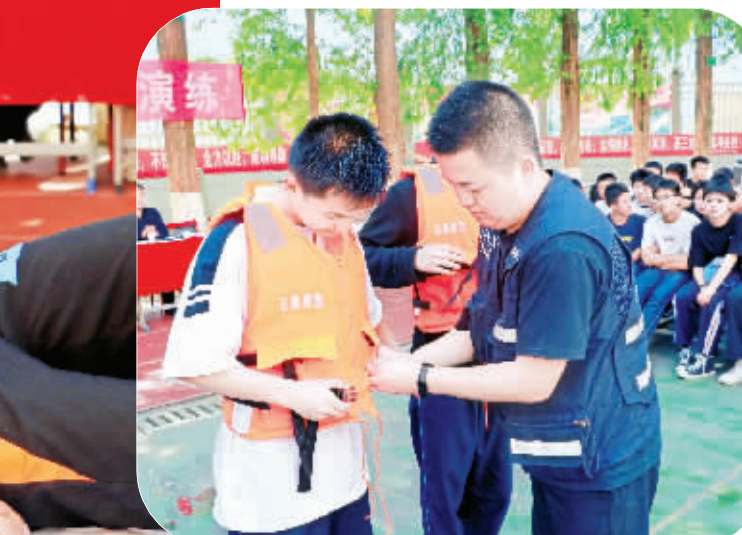
随着夏季气温升高,校园防溺水水压

随着夏季气温升高,校园防溺水水压陡增,近日,石泉县江南中学邀请县应急管理局、城关镇卫生院相关工作人员来校开展了夏季防溺水安全应急演练,通过创设“溺水情景”、实操科学施救、体验应急处置等方式,手把手指导学生如何自救、智慧施救,提高大学生防溺水安全自救的自觉性和应急施救的能力,共同筑牢校园夏季防溺水安全屏障。