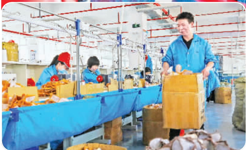
近日,汉滨区大河镇康悦铭工艺品有限公司各车间一派忙碌景象。据了解,该企业建筑面积约4000平方米,总投资500万元。前期已投入150万元,配备缝纫机60余台,预计年生产玩具300万只,可提供就业岗位300余个。