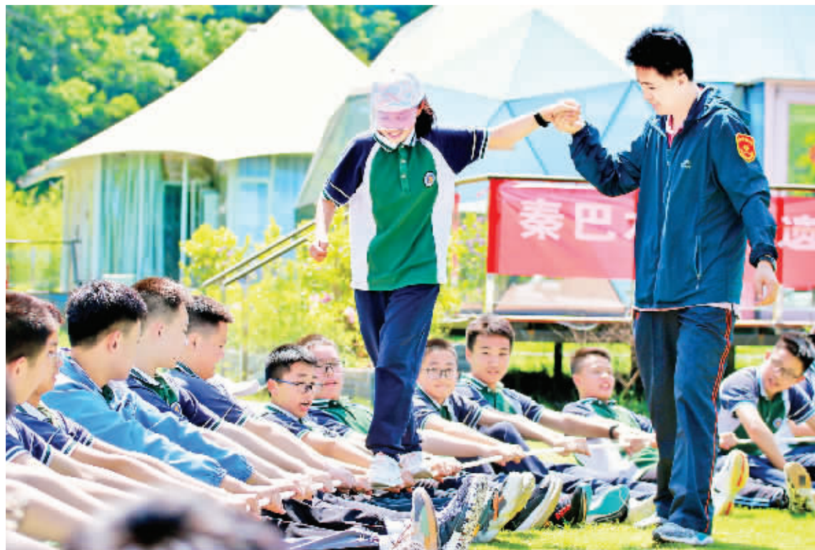
5月6日,汉滨初中高新校区八年级(2)班集体研学活动走进石泉县,师生们先后在饶峰驿站、中坝镇坊小镇进行了拓展训练和参观实践等活

布局合理、场所相对独立的标准。汉滨区司法局建民司法所、岚皋县司法局民主司法所、镇坪县司法局曾家司法所等53个司法所通过省检查组的验收,达到省级新时代“六好司法所”创建标准,其中平利县司法局老县司法所、旬阳县司法局吕河司法所、石泉县司法局池河司法所等14个司法所被命名为全省“新时代六好司法所示范单位”。