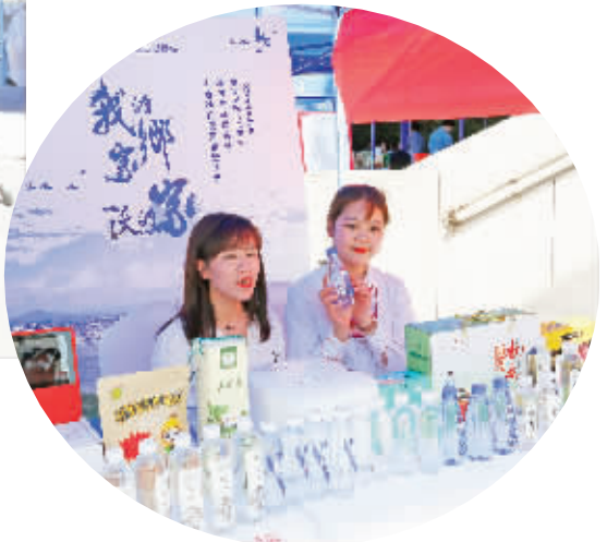
直播展销安康富硒水。