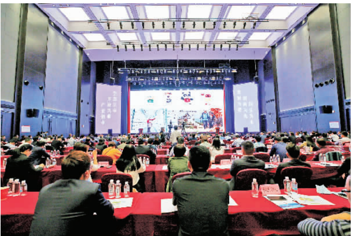
安康地方产品展销暨本地推广使用推进大会会场。