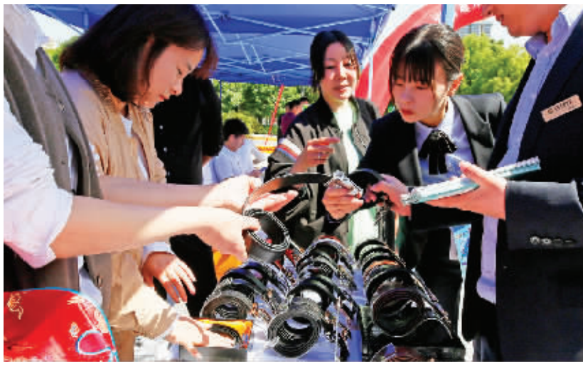
市民现场采购我市生产的生活用品。