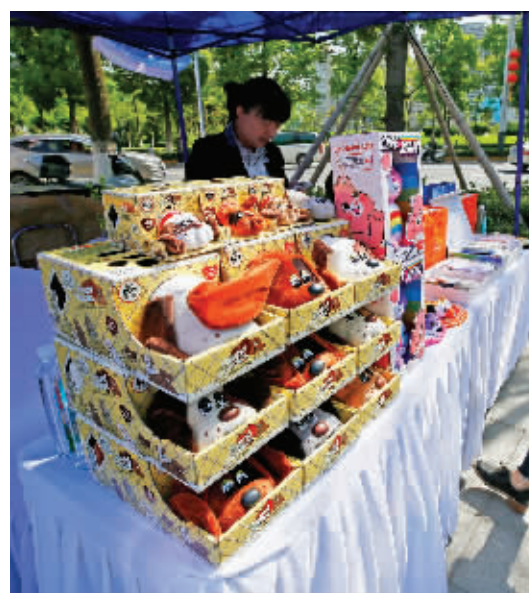
安康毛绒玩具展台。