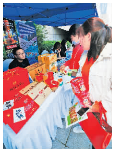
安康特色小吃吸引众多消费者。