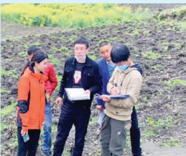
中国平安财产保险股份有限公司安康中心支公司——农险理赔现场查勘定损