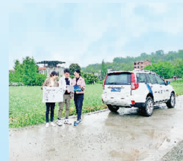
中国太平洋财产保险股份有限公司安康中心支公司——在田间地头宣传农业保险