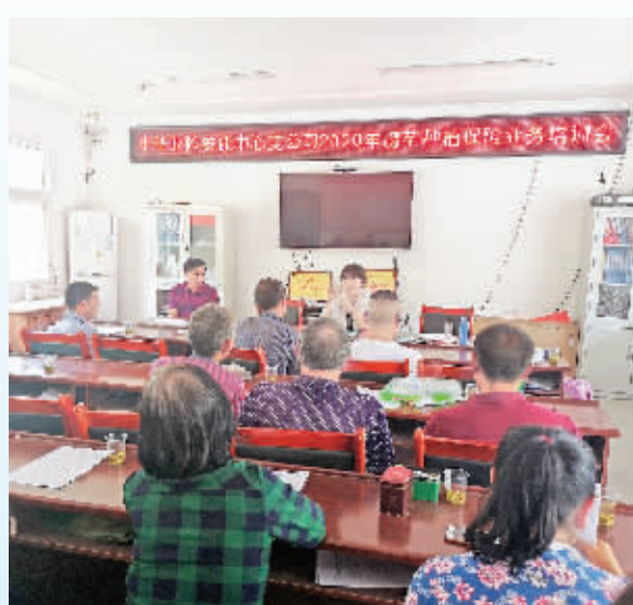
中华联合财产保险股份有限公司安康中心支公司——骡马收入保险培训会