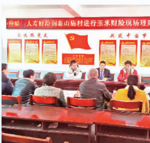
中国人寿财产保险股份有限公司安康中心支公司——汉滨区玉米种植保险现场理赔会