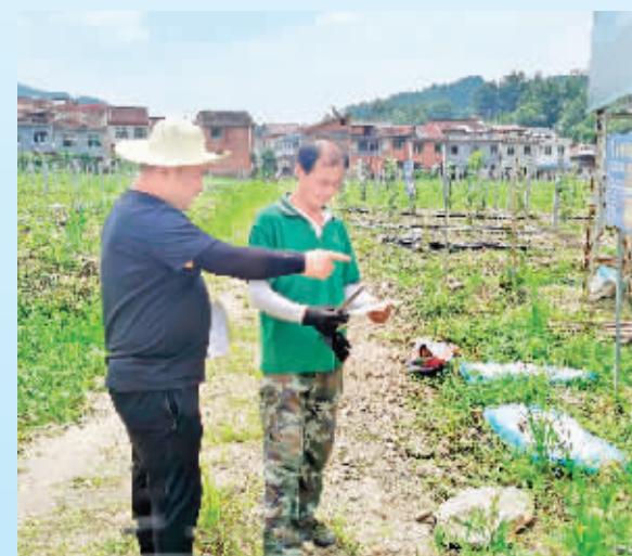
永安财产保险股份有限公司安康中心支公司——开展承保到户工作